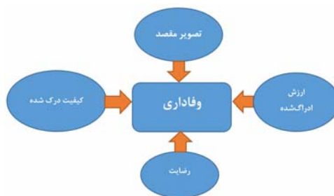
شکل شماره ۱. مدل مفهومی پژوهش

بی تفاوت باشند، درواقع با توجه به ویژگی‌ها، قیمت و، تسهیلات مرتبط با محصول و نیز تقریباً بدون توجه به نام و نشان تجاری آن، خرید می‌کنند. در این حالت، احتمالاً ارزش ویژه برند بسیار کم است. ولی اگر مشتریان، حتی در صورتی که رقبا، ویژگی‌های بهتر، قیمت و یا تسهیلات مناسب‌تر نیز ارائه می‌کنند، به خرید از برند خاصی ادامه دهند، این منجر به افزایش قابل توجه آن برند خواهد شد، بنابراین می‌توان وفاداری به برند را به‌عنوان تعهدی برای خرید مجدد تعریف نمود (Gil,2007:189).