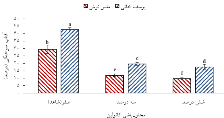
شکل ۱. اثر محلول پاشی غلظت‌های مختلف کائولین بر درصد آفتاب سوختگی میوه دو رقم انار