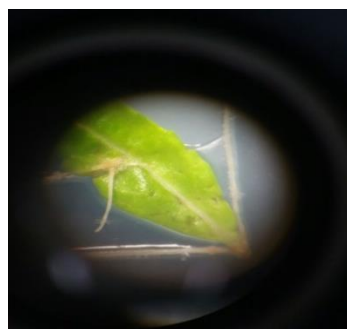
شکل ۳. ریشه موپین القاشده با سویه A4 در گونه دارویی زوفا Figure 3. Hairy roots of hyssop ( Hyssopus officinalis ) induced by A4 strain

تاکنون تأثیر سویه‌های مختلف A. rhizogenes بر القای ریشه موپین در بسیاری از گیاهان مطالعه شده است. هر گونه گیاهی دارای ساختار دیواره سلولی، وضعیت فیزیولوژیکی و مولکول‌های علامت دهنده متفاوتی است که ممکن است موجب تفاوت در توانایی تشکیل ریشه موپین در گونه‌های مختلف باشد (Kuzovkina & Schneider, 2006). در این مطالعه تأیید شد که توانایی سویه‌های مختلف در انتقال ژن به سلول گیاهی متفاوت است. از بین سویه‌های بررسی شده در این آزمایش، سویه‌های ATCC15834 و A4 بیشترین کارایی را در تشکیل ریشه‌های موپین داشتند (شکل‌های ۳ و ۴). این تفاوت در بیماری‌زایی باکتری و ریشه‌زایی گیاه، به پلاسمیدهای قرار گرفته در سویه‌های باکتری مرتبط است (Ooi et al. , 2013).