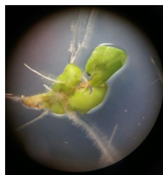
شکل ۴. ریشه موپین القاشده با سویه ATCC15834 در گونه زوفای باریک برگ