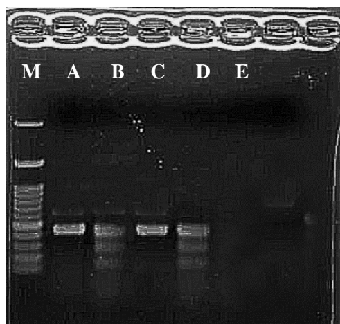
شکل ۲. تحلیل PCR با آغازگر اختصاصی ژن rol B (M) نشانگر اندازه 1KB، (A و B) به ترتیب DNA پلاسمید Agrobacterium rhizogenes سویه‌های 2656 و LB9404، (C و D) به ترتیب DNA ریشه‌های موپین گونه زوفای دارویی ( Hyssopus officinalis ) و زوفای باریک برگ ( Hyssopus angustifolius )، (E) ریشه غیر تراریخت گونه ( Hyssopus officinalis )

Figure 1. PCR detection of rol B gene, A-B: plasmid of different Agrobacterium rhizogenes strains including: A4 and ATCC15834, M: DNA molecular weight (1 Kb), C-D: DNA of two hairy roots including: Hyssopus officinalis and H. angustifolius and E: non-transformed roots of Hyssopus officinalis