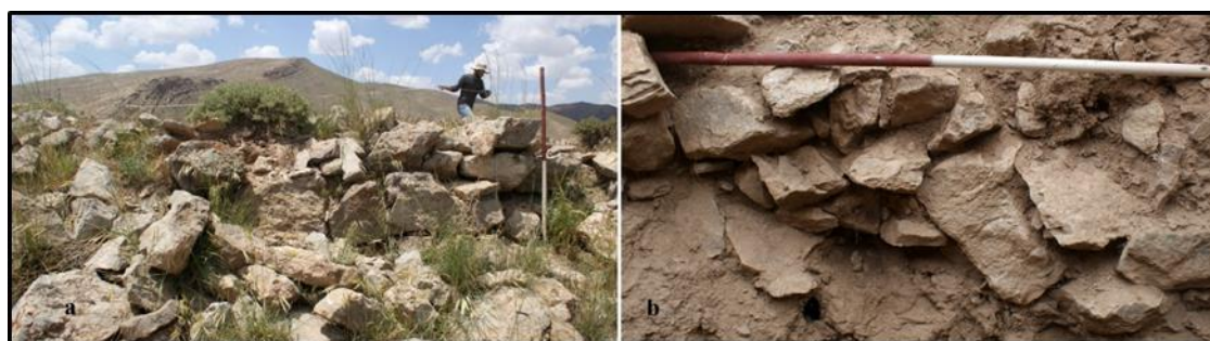
تصویر ۵: (A) دیوار بیرونی سازه زیزگان; (B) ساختارهای سنگی نمایان در چاله‌های حفاری غیرمجاز (نگارندگان، ۱۳۹۲).

با توجه به حجم وسیع آوار حاصل از تخریب سازه، وضعیت ورودی بنا قابل تشخیص نیست. متأسفانه در جای‌جای بخش درونی این بنا، حفاری‌های غیرمجاز گسترده‌ای صورت گرفته که همین امر در سطح وسیعی به تخریب آن انجامیده است. با این حال، درون برخی از چاله‌های مذکور، می‌توان بقایای ساختارهای سنگی که در گذشته داخل حصار مدور آن ایجاد شده بودند را شناسایی نمود (تصویر ۵). این ساختارها نیز به‌مانند سایر بخش‌های بنا، با استفاده از لاشه‌سنگ‌های کوچک و ملاط گل ایجاد گردیدند.