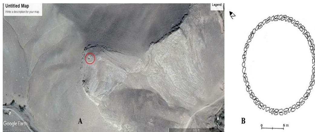
تصویر ۴: (A) عکس هوایی سازه زیزگان (Google Earth); (B) پلان سازه سنگی زیزگان (نگارندگان، ۱۳۹۲).

سازه سنگی زیزگان (Zizgan) در فاصله ۵۵ کیلومتری جنوب‌غربی شهر قم و ۳۰۰ متری شمال‌غربی روستای زیزگان، از توابع بخش خلجستان واقع شده است. این بنا، در جریان بررسی‌های میدانی نگارندگان در استان قم شناسایی و مورد مطالعه قرار گرفت. سازه مذکور بر روی کوهی نسبتاً بلند و مشرف به روستای زیزگان، با پلانی مدور به قطر تقریبی ۱۶ متر، با مصالح لاشه‌سنگ‌های بزرگ و کوچک و ملاط گل احداث شده است (تصویر ۴).