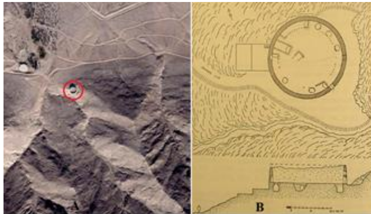
تصویر ۳: (A) عکس هوایی دخمه ری : (B) پلان و مقطع دخمه ری (Kleiss, 1987; 370)