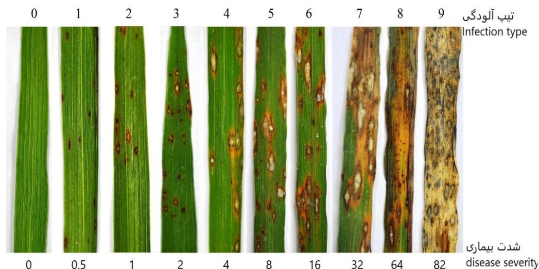
شکل ۱- تیپ و درصد آلودگی به بیماری بلاست برنج بر اساس مقیاس (IRRI, 1996)