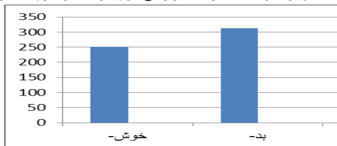
نمودار ۱- نمودار بسامد وقوع پیشوندواره‌ها در پیکره سخن

مختلف و بیان آن در زبان با کمک واحدهای ساختوازی مختلف است. قبل از پرداختن به تحلیل، ارائه نموداری از بسامد این عناصر زبانی در پیکره سخن لازم به نظر می‌رسد.