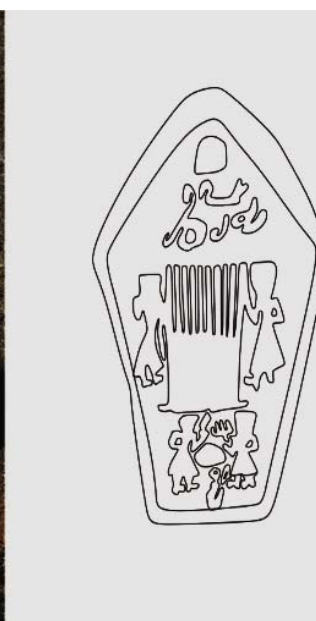
تصویر ۳. جزئیاتی از هنر بافندگی (دار قالی) زنان ایلی کرمانشاهان بر سنگ قبرها