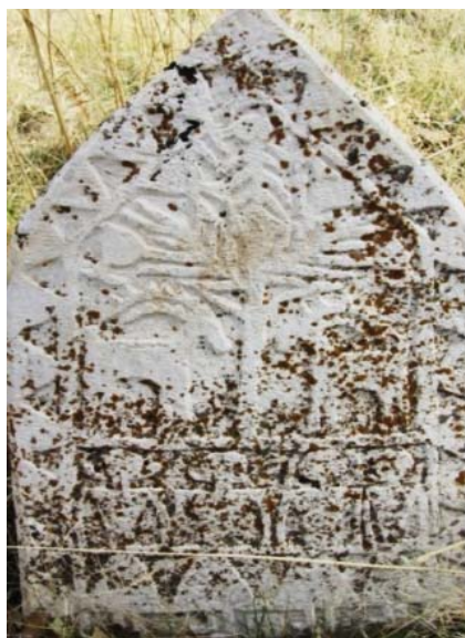
تصویر ۲. جزئیاتی از سنگ قبرهای زنان ایلی کرمانشاهان دوره قاجار، منبع: نگارندگان