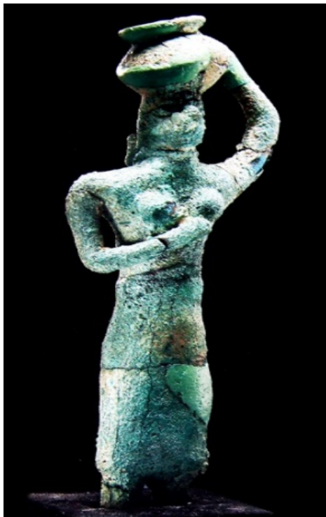
تصویر ۵. پیکره مفرغی بانو، یافت‌شده از شهر سوخته [تصویر از موزه ملی ایران]

د) دین: هنوز سندی قطعی برای آگاهی از دین مردمان شهر سوخته به دست نیامده است. از دوره نخست شهر سوخته یک سردیس زنانه و از دوره دوم شمار بیشتری پیکرک‌های زنانه یافت شده است [۴۲، ص ۱۷۷]. بیشتر این پیکره‌ها به دو گونه‌اند: الف) نشسته، ساده‌شده با شکم برآمده و ب) نیم‌تنه با دست‌ها روی شکم. این پیکره‌ها یادآور نمونه‌های بسیاری از تندیس‌های باروری‌اند [ان.ک: ۸] که از سوی سایر تمدن‌های آن دوران ساخته شده‌اند و به رواج اندیشه‌های همبسته با مذاهب برکت‌خیزی در جامعه شهر سوخته اشاره دارند.