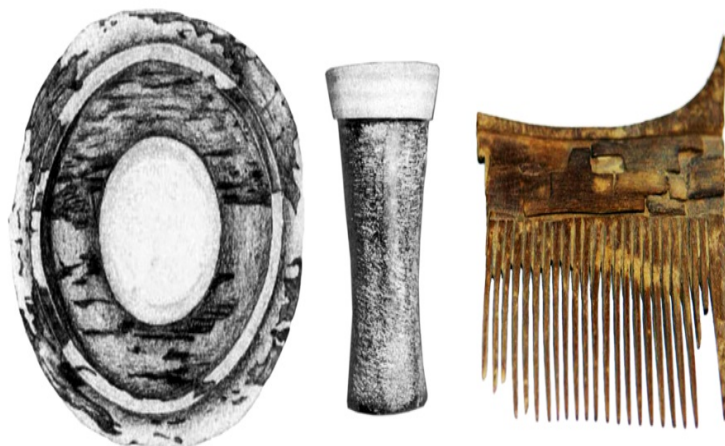
تصویر ۴. بخشی از گوراوندهای متعلق به بانوی آرمیده در گور ۱۴۰۰ [ص ۲۶، ۸۳ و ۸۴]

درون حدود ده درصد از گورها بزغاله‌ای به همراه جسد دفن شده است. صاحبان این گورها که به سبب کمبود گورآوند افراد فقیری به نظر می‌رسند، احتمالاً چوپان بوده‌اند. تقریباً همه این‌گونه گورها به مردان تعلق دارند [ص ۵، ۳۳۵] و مشخص است که زنان به این شغل کم‌درآمد اشتغال نداشته‌اند. دلیل دیگر دوری زنان از این شغل می‌تواند سختی کار شبانی و نیاز به ماندن در کنار رمة بیرون از منطقه شهری باشد.