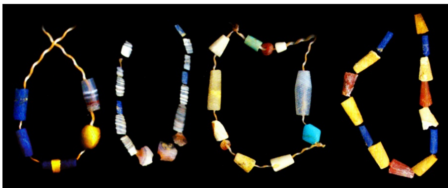
تصویر ۱. شماری از مهره‌های زینتی یافت‌شده از گورهای شهر سوخته [۴۵، ص ۱]

برای آگاهی از جایگاه اجتماعی یک انسان باستانی ارزیابی اشیایی است که همراه وی در گور نهاده شده است. گورآوندهای شهر سوخته را می‌توان به پنج دسته اشیای کاربردی روزمره، زینتی، آیینی، مربوط به پیشه‌ها و مواد خوراکی بخش کرد. در گورهای شهر سوخته آثاری همچون ظرف‌های گوناگون (از جنس سفال، سنگ و به‌ندرت فلز)، مهرهای استوانه‌ای و مسطح (از جنس فلز، سنگ، لاجورد و استخوان)، مهره‌های زینتی (از جنس عقیق، فیروزه و لاجورد) (تصویر ۱)، ابزارهای آرایش (همچون سرمه‌دان، میل سرمه، هاون‌های بزرگ‌سب، پودرهای آرایشی، آینه‌های مفرغی و شانه‌های چوبی) حصیر، سبد، پارچه و ابزارهای کار فرد در گذشته به‌همراه وی دفن شده‌اند. در برخی از تدفین‌ها جانورانی نیز قربانی شده و در کنار جسد قرار گرفته‌اند. خوراک‌های گوناگونی (همچون گوشت جانوران، پرندگان و ماهیان، گندم، جو، انگور، سیر، گشنیز، بنه، عدس و...) نیز درون ظرف‌ها یا پارچه‌هایی در گورها قرار داده شده‌اند. این آثار فقط بخشی از گورآوندهایی است که مردمان شهر سوخته در کنار درگذشتگان خود نهاده‌اند و آسیب‌های محیطی در گذر پنج تا چهار هزار سال بخشی مهم از آثار فلزی یا آلی درون گورها را از بین برده است [۶، ص ۲۳۷]. در ادامه داده‌های باستان‌شناختی همبسته با زنان که از گورستان شهر سوخته یافت شده‌اند، بررسی خواهند شد.