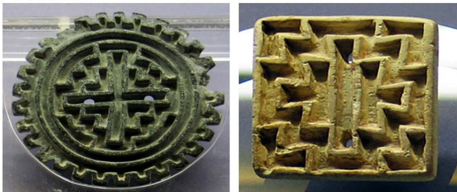
تصویر ۲. شماری از مهرهای یافت‌شده از گورهای شهر سوخته

در کاوش‌های انجام‌شده بین سال‌های ۱۳۸۰ تا ۱۳۸۲، شمار بیشتری مهر به‌دست آمد. طی این دوره ۱۳ مهر (۹ مهر مسطح سنگی، استخوانی و فلزی و ۴ مهر استوانه‌ای از لاجورد و سنگ) یافت شد. در این شمار نیز ۸ نفر از دارندگان مهرها زن‌اند و فقط یک نفر از آن‌ها مرد بوده است [۳۷، ص ۲۳۷].