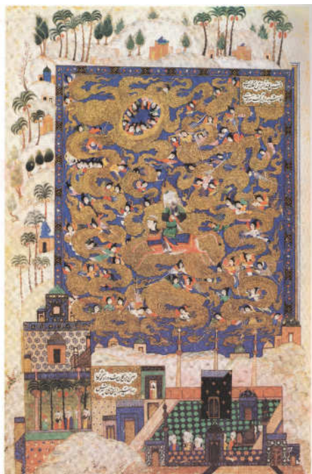
تصویر ۵- معراج پیامبر، خمسه نظامی، تبریز، سال ۹۱۱ هجری. ماخذ: کوزیکان و سیکر، ۱۳۸۷، لوحه ۲۹

هنگامی که سلطان خلیل، پس از مرگ پدر در سال ۸۸۳ هجری به تبریز رفت و بر تخت سلطنت آق قویونلوها تکیه زد، جملگی این هنرمندان به تبریز مهاجرت کردند و در کتابخانه سلطنتی آق قویونلوها به تولید آثار هنری پرداختند. در دوره سلطان ابراهیم تیموری، کلان‌ترو رییس کتابخانه سلطنتی او، مولانا نصیرالدین محمد مذهب بود (اژند، ۱۳۹۳، ۱۸۱-۱۸۴). معلوم نیست که مولانا نصیرالدین محمد در روزگار ترکمان فعال بوده و یا دارفانی را وداع گفته، چون در متون، نامی از او ذکر نمی‌شود. از هنرمندان دیگر شیوه شیراز مکتب ترکمان، سعدالدین مذهب و فرهاد است که نام هر دو در نسخه‌های خطی ثبت است. فرهاد همان نقاشی است که خاوران نامه ابن حسام را نگارگری کرده است و سعدالدین مذهب هم علاوه بر تذهیب، در تصویرپردازی دست داشته است. از دیگر هنرمندان