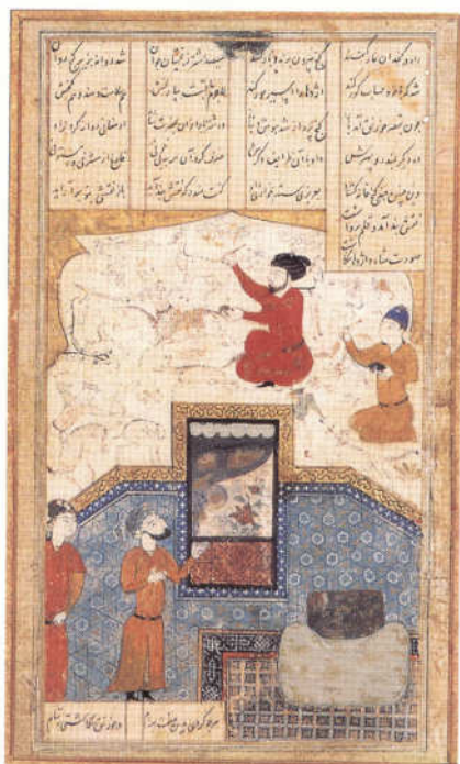
تصویر ۴- نقاشی دیواری قصر خورنق، خمسه نظامی، حدود سال ۸۷۲ هجری. ماخذ: (سودآور، ۱۳۸۰، ۱۳۸)

گفتنی است که در زمان سلطان خلیل، سبکی خاص در کاربرد رنگ در نگاره‌ها شکل گرفت که به سبک کومرال ۱ یعنی قهوه‌ای خام معروف شد (رایبسن، ۱۳۸۴، ۳۹). نگاره‌های این سبک، اجرایی دقیق و مهذب دارند و بیشتر خاص دوره آق‌قویونلوهاست. نسخه‌های این سبک بیشتر متعلق به دهه ۸۸۰ هـ. یعنی پس از حکومت سلطان خلیل در شیراز است. البته از نظر کیفیت، نازل‌تر از نسخه‌هایی هستند که در زمان سلطان خلیل تولید شده‌اند و پیداست که ویژگی‌های بازاری و تجاری بر آنها حاکم است. بعدها نسخه جمال و جلال آصفی، از تأثیر این سبک به دور نماند. در این سبک، بهره‌گیری از رنگ قهوه‌ای تند در مقابل سیاه و ارغوانی، برای