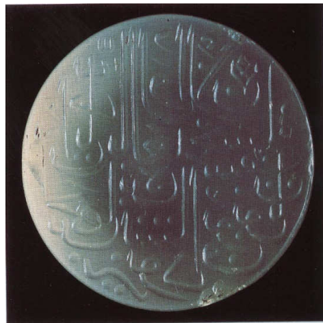
تصویرا - مهر پیربوداق، یشم سبز. ماخذ: (سودآور، ۱۳۸۰، ۱۲۹)