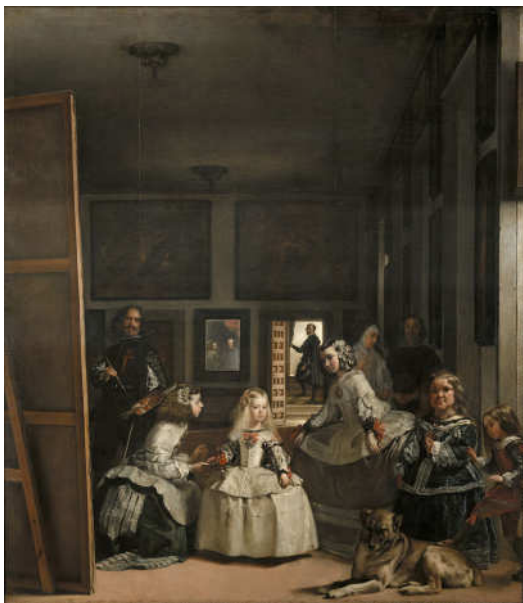
تصویر ۲- ندیمه‌ها، دیه‌گو ولاسکس، ۱۶۵۶م. رنگ و روغن روی بوم، ۲۷۴*۳۲ سانتیمتر، موزه‌ی پرادو، مادرید، اسپانیا.

ذات انسان در بدن مندی او تعریف می‌شود که نسبت بدن با جهان، همچون قلب برای یک پیکر است که به آن هستی بخشیده و به همراهش یک نظام ۴۱ را تشکیل می‌دهد. تعبیر جالب مرلوپونتی از بدن، "نقطه‌ی صفر" است؛ به این معنا که سرآغاز تمام ادراکات و تجربیات آدمی است. همچنین به هنگام ادراک، بدن