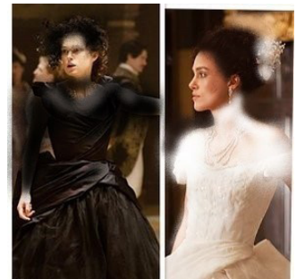
تصویر ۴- آنا در ۲ صحنه متضاد.