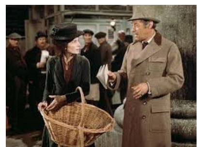
تصویر ۱۰- سکانس آغازین.