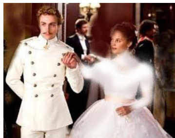
تصویر ۲- کنت ورونسکی و نامزدش.