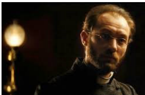
تصویر ۶- الکسی کارنین.