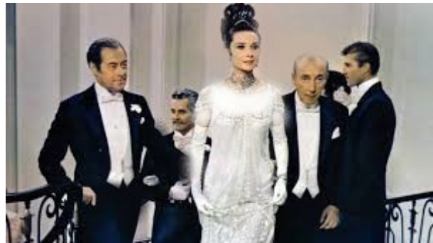
تصویر ۱۵- سکانس پایانی.

همانطور که سیاهی و سفیدی، چه از منظر روان‌شناسی و چه از نظر زیباشناسی و بصری، در دو نقطه مقابل یکدیگر قرار دارند، در فیلم آناکارنینا ، شخصیت‌های مثبت و منفی داستان در جایی که در مقابل یکدیگر قرار دارند، دارای پوشش و لباس سفید و مشکی می‌شوند. در فیلم بانوی زیبای من ، بازیگر اصلی در حال نبرد درونی و یا تحول شخصیتی است و روند از تیرگی به روشنایی، نشانگر رو به مثبت رفتن و پیشرفت شخصیتی و رفتاری وی است. در نتیجه در هر صحنه‌ای از فیلم که تضاد شخصیتی بازیگران و یا یک بازیگر با خودش به تصویر کشیده می‌شود، رنگ سیاه و سفید لباس، نقش مهمی را ایفا می‌کند. به نظر می‌رسد با توجه به نظریه‌ی بارت؛ هر کدام از عناصر سیاه و سفید به تنهایی معنایی