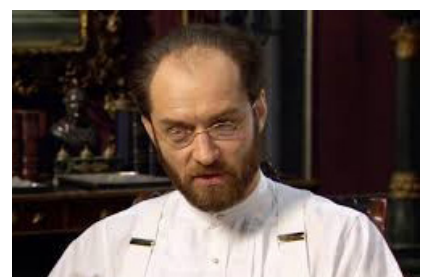
تصویر ۷- الکسی کارنین.