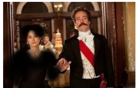
تصویر ۱- آنا و برادرش.