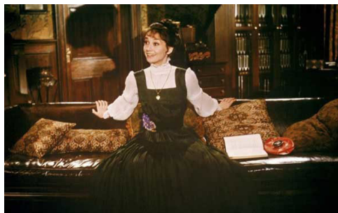
تصویر ۱۲- الیزا: تصویر از نگارنده برگرفته از فیلم

همانطور که گفته شد، لباس در کارکرد رسانه ای خود، بیان را به واسطه ی رنگ، نقش ها و نقش مایه ها و همین طور نقش مایه های زبانی نوشتار روی لباس (ممکن می سازد؛ از این رو شناخت چنین