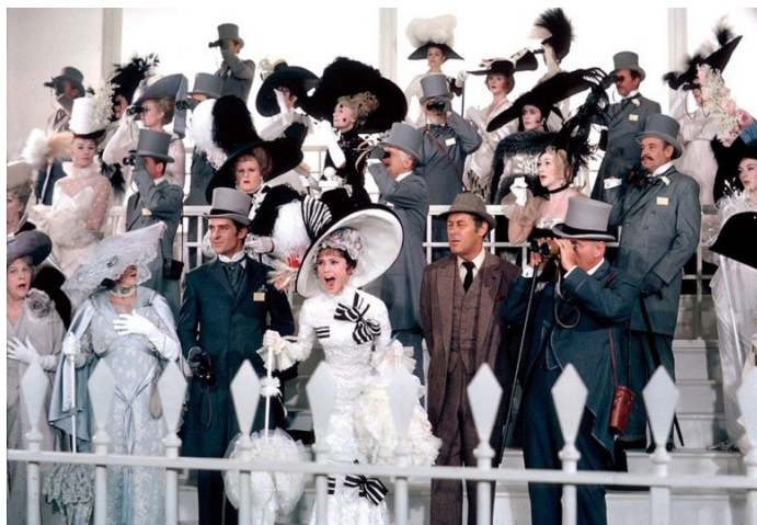
تصویر ۱۴- صحنه ی اسب دوانی.