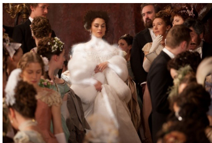
تصویر ۳- آنا در مهمانی.

در ادامه فیلم، لباس آنا از آنجایی که ناراضی از روابط زناشویی و همچنین دارای حس گناه نسبت به روابطش با کنت ورونسکی است، همچنان تیره است. ولی پس از آن، در صحنه‌هایی که آنا عشقش به کنت ورونسکی را آشکار کرده است و به دلیل اینکه می‌خواهد در نظر