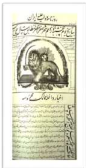
تصویر شماره ۵) نام روزنامه دولت علیه ایران بیرون از کتیبه و حاشیه اصلی، شماره ۴۷۲، ۱۲۷۷ ه. ق. (سازمان اسناد و کتابخانه ملی جمهوری اسلامی ایران).