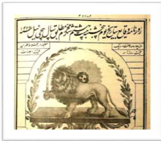
تصویر شماره ۳) روزنامه وقایع، شماره ۴۷۱، سال ۱۲۷۷ ه. ق. (سازمان اسناد و کتابخانه ملی جمهوری اسلامی ایران).