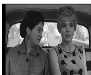
تصویر ۹. کلتو و آنژل سوار بر ماشین؛ تصویر ۱۰. تصویر شهر در پرسه‌زنی با ماشین؛ تصویر ۱۱. تسلط شیشه مغازه در قاب تصویر