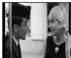
تصویر ۱۲. کلتو و سرباز سوار بر ترن؛ تصویر ۱۳. تصویر شهر در پرسه‌زنی با ترن؛ تصویر ۱۴. چیرگی شهر بر شخصیت‌ها