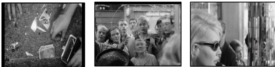
تصویر ۲۰. تصویر تکه‌تکه‌شده کلتو در ستون شیشه‌ای؛ تصویر ۲۱. قطعه قطعه شدن تصویر کلتو؛ تصویر ۲۲. تصویر مخدوش کلتو در آینه شکسته