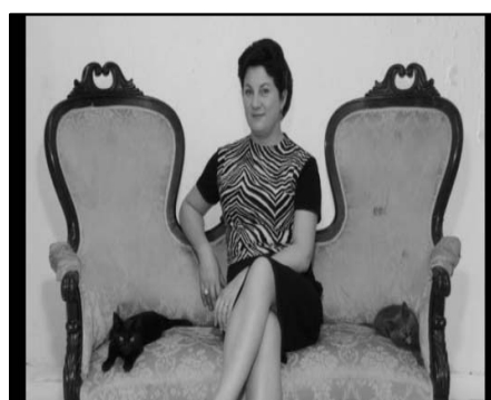
تصویر ۷. زن با لبخندی معنادار نگاهش را به رخ می‌کشد؛ تصویر ۸. مردی که عاشق کلئو است به او/ مخاطب خیره شده است.