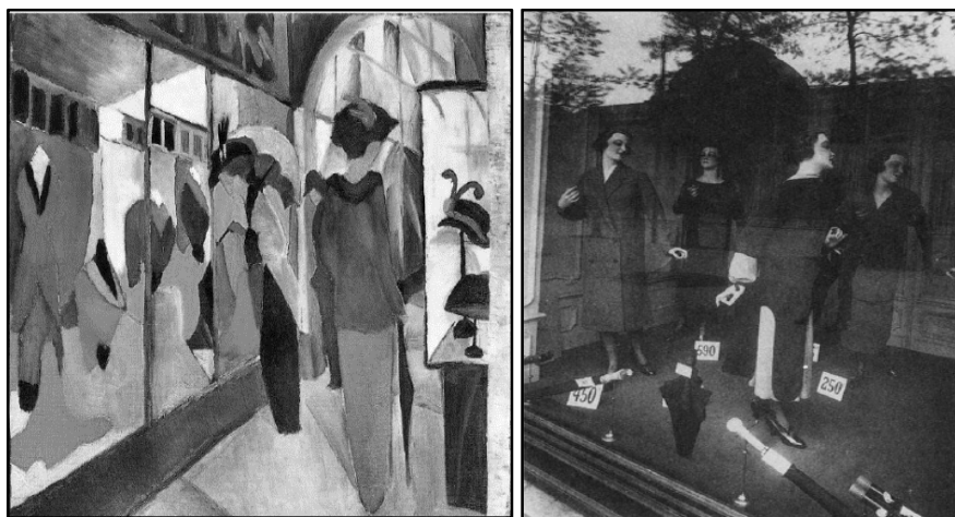
تصویر ۱. ویتترین فروشگاه‌ها [۱۴، ص ۴۲۱]؛ تصویر ۲. آگوست ماکه (۱۹۱۴)، فروشگاه مد [۱۲، ص ۱۶۵]

نگاه خیره» زنانه به شیشه ویتترین مغازه‌ها، نگاهی کلیدی و سرشار از قدرت انتخاب است [۱۵]، ص ۳۴]. او نگرستن به ویتترین فروشگاه‌ها و پرسه‌زنی را از منظر رابطه میان جنسیت و قدرت سوپژکتیو در پیوند با یکدیگر قرار می‌دهد، اما باین حال تصدیق می‌کند که آزادی زنانه هنگام خرید برابر با آزادی مردان پرسه‌زن نیست که بی‌هدف در فضاهای شهری حرکت می‌کردند [۱۵، ص ۳۶].