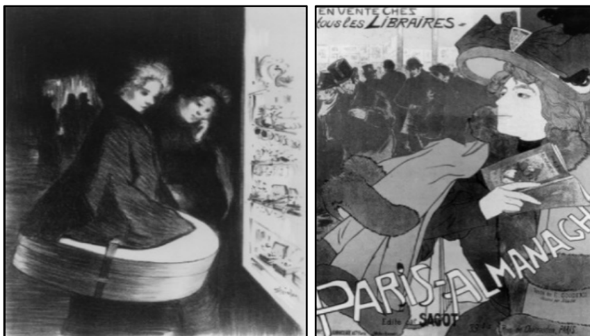
تصویر ۳. پوستر تبلیغی (۱۸۹۴) [۲۰، ص ۳۴۰]: تصویر ۴. لیتوگرافی (۱۸۹۸). تئوفیل الکساندر استینلن [۲۰، ص ۳۴۳]

این پوسترها، که به صورت رنگی و در ابعاد بزرگ در فضاهای شهری نصب می‌شدند، به‌آسانی چشمان مخاطب را با رنگ‌های درخشان و تصاویر جذاب خود خیره می‌کردند. آن‌ها نقشی کلیدی در شکل‌دهی به فرهنگ بصری مدرنیته برعهده داشتند. این پوسترها برای جذب توجه مخاطبی که به هنگام حرکت در شهر در حال پراکنده‌اندیشی و عدم تمرکز بود از استراتژی‌های بصری متفاوت بهره می‌بردند. در بسیاری از این پوسترها، زنان پرسه‌زنی را می‌توان مشاهده کرد که با فراغ بال در حال حرکت و گذار در فضاهای شهر مدرن‌اند و به منظرهای جذاب شهری می‌نگرند. یک پوستر تبلیغی (۱۸۹۴) زن پرسه‌زنی را نمایش می‌دهد که با پوششی فاخر در میان توده جمعیت شهری ایستاده و با نگاه خیره‌اش به فضایی بیرون از قاب تصویر می‌نگرد (تصویر ۳). اما به‌رغم عمل نگاه‌کردن از سوی او، زن به‌منزله یک منظر تماشایی نیز ترسیم شده که نگاه پرسه‌زن‌های مرد را به خود جلب کرده است. در نتیجه، این پوستر نمایانگر ترکیب متضاد نگاه‌های خیره‌ای است که به فضاهای موجود در خیابان یک متروپولیتن در دهه ۱۸۹۰ شکل می‌دادند [۲۰، ص ۳۳۹]. پوستری دیگر، نمایانگر پرسه‌زن‌هایی از طبقه کارگر است که در حال نگرستن به ویتترین مغازه‌ها دیده می‌شوند (تصویر ۴). از آنجا که پوسترهای ذکرشده برآمده از تجربه زیستی دوران خودند و اتفاق‌های آن زمان را تصویر کرده‌اند، می‌توان آن‌ها را به‌منزله اسنادی مبنی بر وجود زن پرسه‌زن در سال‌های انتهایی قرن نوزدهم در نظر گرفت. این پوسترها زنان جدید را در حال انجام‌دادن عمل پرسه‌زنی در شهر مدرن و لذت‌بردن از آن به تصویر کشیده‌اند و نشان می‌دهند «پرسه‌زنی زنانه بخشی ذاتی و جدایی‌ناپذیر از فرهنگ مدرنیته شهری در اواخر قرن نوزدهم بوده است» [۲۰، ص ۳۵۱].