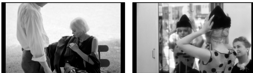
تصویر ۱۵. کلتو کلاه خز را لمس می‌کند؛ تصویر ۱۶. کلتو لباس مرد نظامی را ادراک می‌کند

به طریقی انجام می‌دهد انگار در حال تجربه کاری جدید است (تصویر ۱۶). گویی کلتو با این کار به دنبال کشف چیزهایی است [در اینجا یونیفرم] که در اطرافش قرار گرفته‌اند. تأکید دوربین و فیلم‌ساز بر کنش لمس کردن یونیفرم به حدی است که اولویت قاب‌بندی را به خود اختصاص داده و بخشی از بدن مرد خارج از قاب تصویر قرار گرفته است.