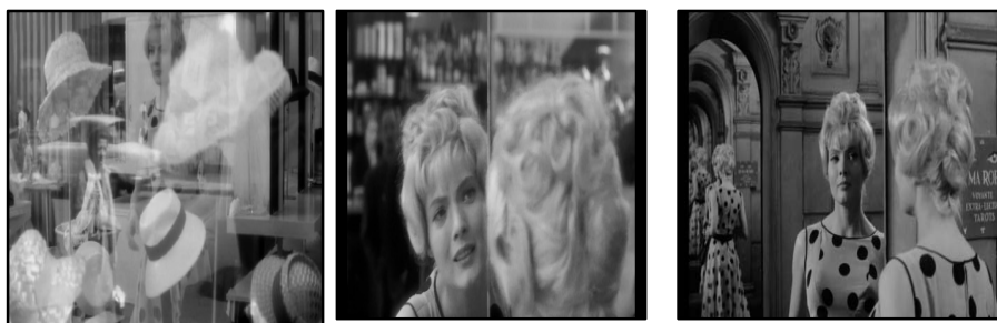
تصویر ۱۷. بدن بت‌واره کلتو تکثیر شده است؛ تصویر ۱۸. تصویر کلتو در آینه کافه؛ تصویر ۱۹. بازنمایی تصویر کلتو بر شیشه فروشگاه