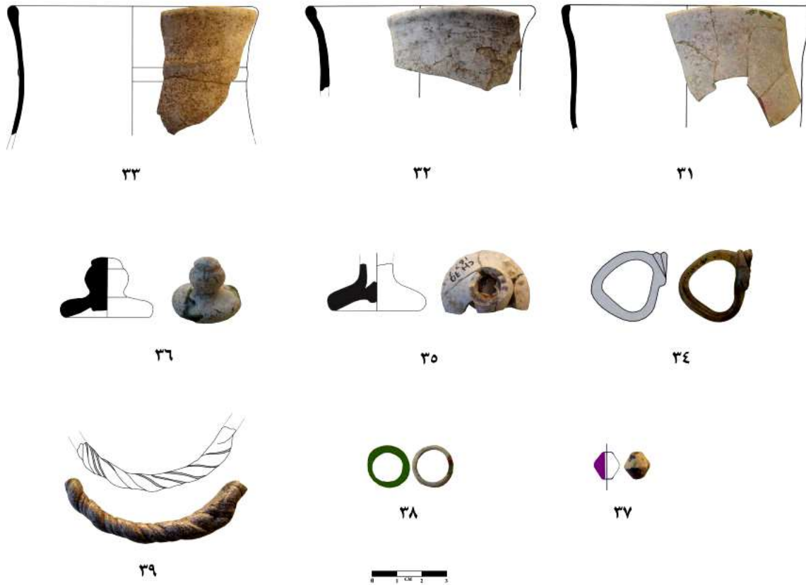
تصویر ۶: تصاویر و طرح‌های یافته‌های شیشه‌های اشکانی کاخ شائور (نگارنده)