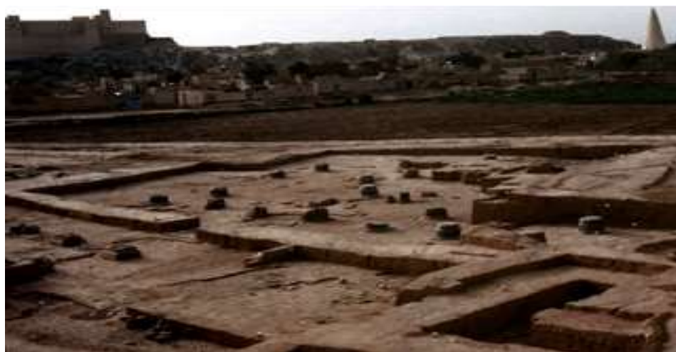
تصویر ۳: نمایی از محوطه و کاخ شائور