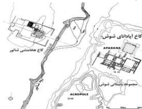
تصویر ۱: نقشه و موقعیت کاخ شائور (پرو، ۱۳۷۶: ۲۱۳)