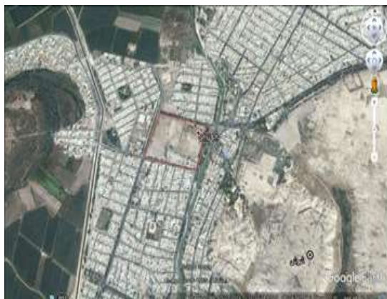
تصویر ۲: عکس هوایی موقعیت کاخ شائور