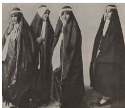
تصویر ۹. عکس پوشش زنان در بیرون خانه، عکاس نامعلوم، متعلق به مجموعه مطالعات تاریخ معاصر ایران، شماره 1261A99

پس بی‌درنگ با مشکل عکاسی از زنان در این دوره مواجه می‌شویم که مسئله‌ای اجتماعی بود. هرچند در ایران آن روز عکاسی از زنان منع قطعی نداشت، عکاسان مرد اجازه ورود به حرمسرا را نداشتند. از این رو عکاسی از زنان تقریباً ناممکن بود. با وجود این، راه‌هایی برای دورزدن این مسئله وجود داشت.