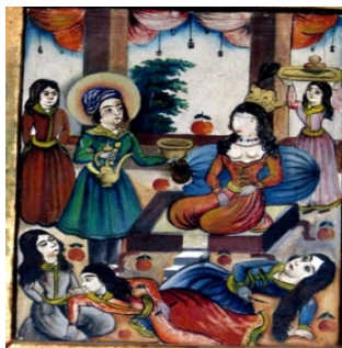
تصویر ۷. نقش یوسف و زلیخا در نقوش دیواری قلعه چالستر، طهماسبی‌زاده و دیگران، ۱۳۹۴: شکل ۳