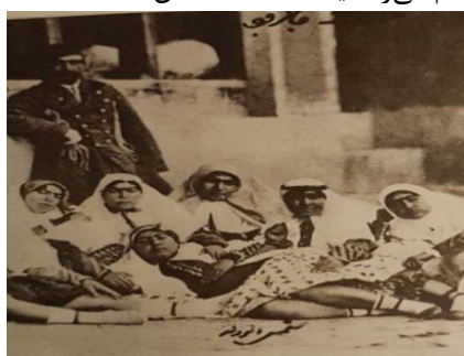
تصویر ۱۱. زنان حرمسرا، عکاس جعفرقلی خان نیرالملک هدایت، برگرفته از کتاب ناصرالدین شاه عکاس، شماره ۱۲

مرحوم استاد ذکا در کتاب تاریخ عکاسی و عکاسان پیشگام در ایران متذکر شده که تنها گروهی از زنان، که به آسانی و راحتی حاضر می‌شدند تا از آن‌ها عکس گرفته شود، نوازندگان، رقاصان و بالاخره روسپیان بودند که گاه به حالت عادی و گاه در حالت نوازندگی و رقص یا با جامه‌های مردانه در برابر دوربین قرار می‌گرفتند. به نظر می‌رسد که از همین زنان نیز باید با اجازه مراجع مذهبی عکس گرفته می‌شد تصویر (۱۳) [۲۴، ص ۱۶۸].