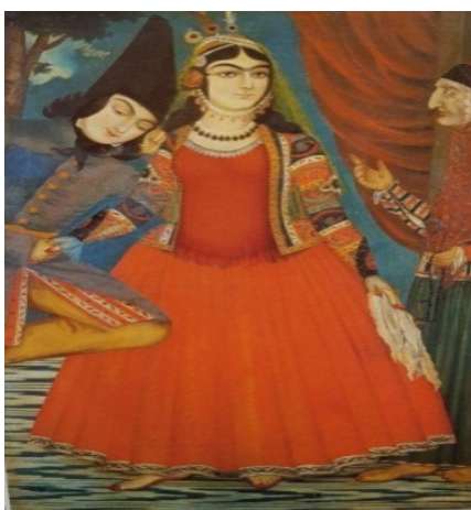
تصویر ۳. زیورآلات زن در دوره قاجار، برگرفته از کتاب زندگی و آثار صنایع‌الملک

خاصی دارد و دست و پایشان نیز ظریف و زیباست جاذبه خاصی می‌بخشد. خانم‌های متشخص و از خانواده‌های برجسته، اغلب تاج الماس گرانبهایی بر سر می‌گذارند. دکتر ویلز [۳۴، ص ۳۶۵-۳۶۶] اذعان دارد که کلیه زنان ایرانی، از هر قشری که هستند، علاقه زیادی به استفاده از طلا و جواهر به‌عنوان زینت‌آلات از خود نشان می‌دهند. زینت‌آلات نقره‌ای مخصوص قشر محروم و کم‌بضاعت، اغلب به صورت دستبند و انگشتری‌های نقره به کار می‌رود. بازوبند ساخته‌شده از طلا و جواهر نیز، که دعا یا طلسمی را در خود دارد، به بازوی خانم‌های ثروتمند بسته می‌شود (تصویر ۳).