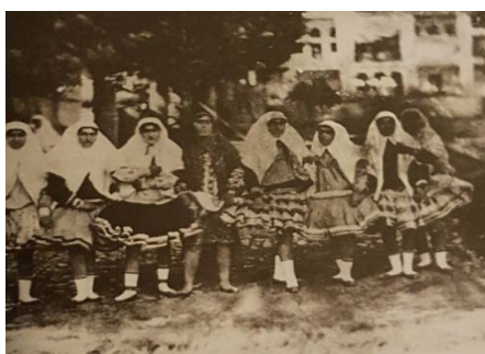
تصویر ۱۲. زنان حرمسرا در نیاوران، عکاس ناصرالدین شاه، برگرفته از کتاب ناصرالدین شاه عکاس، شماره ۱۳

مثلاً نخستین عکس‌های ناصرالدین شاه بیشتر از زنان حرمسرا و غلام‌بچه‌ها و ساختمان‌های قصر سلطنتی و اندرون حرمسرای شاهی است و اولین دستیار او در کار عکاسی جعفرقلی خان نیرالملک هدایت است که با توجه به نسبت محرمیتی که با شاه داشته، اجازه عکس‌برداری در حرمسرای شاه و زنان او را نیز می‌یابد و کار ظهور و چاپ عکس‌ها را نیز وی به انجام می‌رسانیده است [۲۵، ص ۲۶].