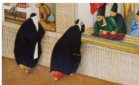
تصویر ۱. پوشش زنان قاجاری در بیرون از خانه، برگرفته از کتاب زندگی و آثار صنایع‌الملک