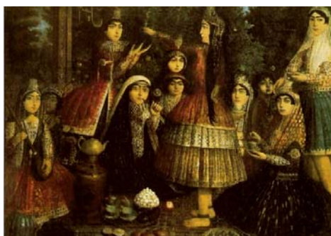
تصویر ۶. زنان درباری گرد سماور، برگرفته از کتاب Painting Persian Royal ، شماره ۸

از میان این تصاویر، بیشتر زنان را در پرده‌هایی مربوط به زنان حرمسرا مشاهده می‌کنیم. این پیکره‌ها اغلب به صورت نشسته، لمیده، تکیه‌داده به مخده پرتزینشان، با صورت‌های بزرگ‌کرده و گونه‌های گلگون با تاج مرصع پرپری بر سر، در جامه‌های پر نقش و نگار مرواریددوزی و جواهرنشان غرق در زیورآلاتی مانند گوشواره، گردنبند، دستبند و... بسیار آرام و راحت، به‌دور از هر دغدغه و آشفتگی ظاهر، در حال استراحت‌اند (تصویر ۶). فضایی که این زنان در آن قرار گرفته‌اند فضایی است بسیار پرتجمل همراه اشیا و وسایل گرانبها. این پیکره‌ها معمولاً یا پیمانه‌ای خالی از شراب در دست دارند و دست راست خود را زیر سر حائل کرده‌اند یا مشغول زینت آرایش سر و موی خودند، یا گل و بادبزی در دست دارند و گاهی نیز در حال بازی با حیواناتی مانند طوطی، گربه و خرگوش به تصویر درآمده‌اند [۸، ص ۷۲-۷۳].