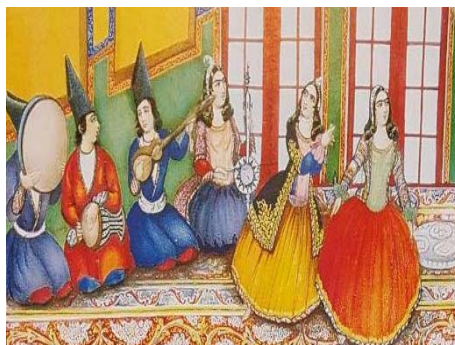
تصویر ۴. نقش زن نوازنده در حال اجرای برنامه در دوره قاجار، برگرفته از کتاب زندگی و آثار صنایع‌الملک

از میان این تصاویر، بیشتر زنان را در پرده‌هایی مربوط به زنان حرمسرا مشاهده می‌کنیم. این پیکره‌ها اغلب به صورت نشسته، لمیده، تکیه‌داده به مخده پرتزینشان، با صورت‌های بزرگ‌کرده و گونه‌های گلگون با تاج مرصع پرپری بر سر، در جامه‌های پر نقش و نگار مرواریددوزی و جواهرنشان غرق در زیورآلاتی مانند گوشواره، گردنبند، دستبند و... بسیار آرام و راحت، به‌دور از هر دغدغه و آشفتگی ظاهر، در حال استراحت‌اند (تصویر ۶). فضایی که این زنان در آن قرار گرفته‌اند فضایی است بسیار پرتجمل همراه اشیا و وسایل گرانبها. این پیکره‌ها معمولاً یا پیمانه‌ای خالی از شراب در دست دارند و دست راست خود را زیر سر حائل کرده‌اند یا مشغول زینت آرایش سر و موی خودند، یا گل و بادبزی در دست دارند و گاهی نیز در حال بازی با حیواناتی مانند طوطی، گربه و خرگوش به تصویر درآمده‌اند [۸، ص ۷۲-۷۳].