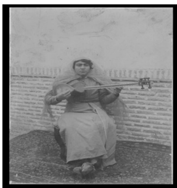
تصویر ۱۳. زن نوازنده، متعلق به مجموعه مطالعات تاریخ معاصر ایران، شماره 1267B72

مرحوم استاد ذکا در کتاب تاریخ عکاسی و عکاسان پیشگام در ایران متذکر شده که تنها گروهی از زنان، که به آسانی و راحتی حاضر می‌شدند تا از آن‌ها عکس گرفته شود، نوازندگان، رقاصان و بالاخره روسپیان بودند که گاه به حالت عادی و گاه در حالت نوازندگی و رقص یا با جامه‌های مردانه در برابر دوربین قرار می‌گرفتند. به نظر می‌رسد که از همین زنان نیز باید با اجازه مراجع مذهبی عکس گرفته می‌شد تصویر (۱۳) [۲۴، ص ۱۶۸].