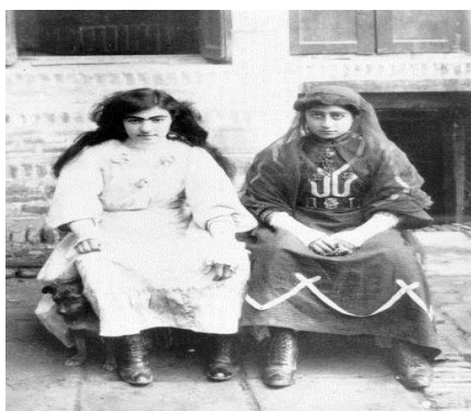
تصویر ۱۰. عکس پوشش زنان در داخل خانه دوره قاجار، عکاس نامعلوم، متعلق به مجموعه مطالعات تاریخ معاصر ایران، شماره 1261A132

به دلیل منع مذهبی و مخالفت اقشار مسلمان به عکاسی از بانوان، این بخش از عکاسی دوره قاجار همواره از کارهای پیچیده و مشکل یک عکاس به شمار می‌رفت، زیرا زنان به عکاسان مرد در حالت کشف حجاب و بدون داشتن چادر و روبنده نامحرم شمرده می‌شدند و این عمل از نظر روحانیان و مراجع مذهبی مذموم و منهی شمرده می‌شد [۲۴، ص ۱۷۱]. حاکم‌بودن فضای سنتی و مذهبی بر اجتماع دوره قاجار سبب شده بود که زنان چهره خود را چه در بیرون و چه در محیط‌های داخلی همواره از نامحرمان پوشیده نگاه دارند (تصویر ۹ و ۱۰). به همین دلیل، کمتر زنی حاضر بود به میل و اراده خود بی‌حجاب در مقابل دوربین مردان نامحرم قرار بگیرد، زیرا از آن واهمه داشت که چهره‌اش را مرد نامحرم، چه در حین عمل عکاسی و چه پس از آن در عکس کاغذی، ببیند یا عکس چهره‌اش به دست مرد نامحرم بیفتد.