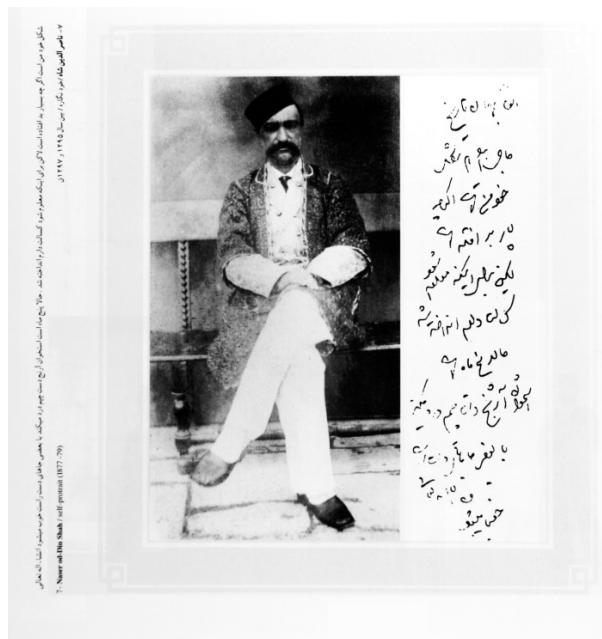
تصویر ۴- خودنگاره‌ی ناصرالدین شاه.

ترومای عکاسی، مواجهه‌ی زود هنگام جامعه با این فن‌آوری و واقعیت‌نمایی افراطی آن حتی در مقوله‌ی جنسیت بود. نیاز به توضیح مفصل ندارد که در زندگی کاخ‌نشینی و شاهنشاهی، حرم‌سرا کانونی مهم برای تملک نایب‌السلطنه (ناصرالدین میرزا) بعد از تکاپو برای کسب مقام شاهی از جنگ پدر (محمدشاه) باشد، ولی راه ورود به عرصه‌ی شاهی باید از عرصه‌ی زناشویی برای ولیعهد بگذرد، تا مقدمات جلوس او بر تخت شاهی را فراهم آورد. ۴۹ ترس محرومیت از پادشاهی و حرم‌سرا، ولیعهد را نوجوانی مطیع و نابینا (با شرم و حیا) در مقابل زنان و دختران کاخ می‌کرد. ۵۰ ترسی که از طرف پدر و ساحت نام‌پدر ولیعهد را تهدید می‌کند،