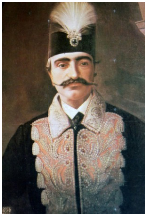
تصویر ۳- ناصرالدین شاه، اثر کمال الملک، ۱۸۸۱/۱۲۹۸ ق.

برای شرح این بی‌پردگی، بهتر است بحث را کمی پیش‌تر از ورود عکاسی در دوره‌ی ناصری و با یک «سوپرایگوی» ۴۳ خیالی در روان سوژه‌ی جمعی و همچنین کارکرد ذهنی آن آغاز کرد. شاه در «ساحت خیالی» ۴۴ جامعه، به عنوان موجودیتی آغشته به دوگانگی قدرت و تقدس، از قرن‌ها پیش، جزئی لاینفک از ساحت نام‌پدر در ذهن جمعی ایرانیان بوده است. ۴۵ شاه، دالی اعظم در یک جامعه‌ی سنتی و نیز عجین شده با دال ازلی خدا، در رأس هرم ساختاری جامعه قرار دارد. شاه، به عنوان مثال فتحعلی شاه، نه بدان صورت که دیده می‌شود، بلکه بدان صورت که باید در عرف عام پنداشته شود، نقاشی می‌شود؛ در هیئتی رسمی، هیبتی مقتدر و هیکلی قادر (کمال مطلوب) و در شمایل شخصی که حکومت از جانب خدا به او