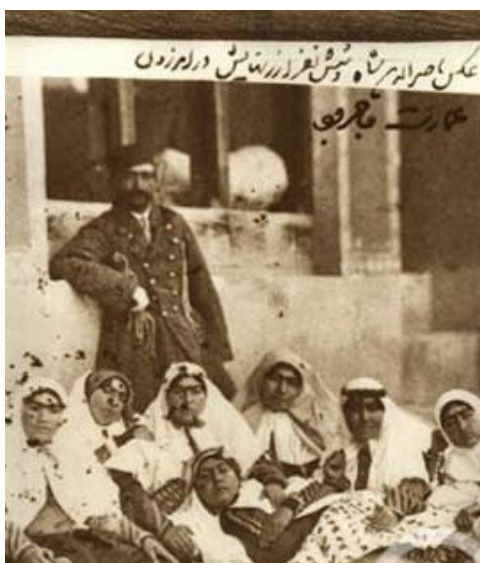
تصویر ۵- ناصرالدین شاه و زنانش در اندرونی، عکاس ناصرالدین شاه. ماخذ: (ذکا، ۱۳۸۴، ۲۹)

«تابو»، چیزی یا جایی است که برای کسانی تحریم می‌شود؛ به عبارتی دارای حریم است؛ پرده‌پوش و پرده‌نشین است؛ حجاب و پوشش دارد. تابو در بردارنده‌ی دو معنای متضاد است؛ از یک سر دارای قدرت و تقدس و از سردیگر دارای ممنوعیت برای دیدن و تماس است. تابو، قانون‌پذیر و دارای قانون است؛ بنابراین،