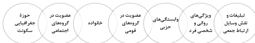
شکل ۱. عوامل مؤثر بر رفتار انتخاباتی

در میان مراحل جدایی‌گزینی، مهاجرت گروه‌های انسانی و اسکان آن‌ها در محله‌های خاص فضاهای شهری به‌عنوان مرحله بنیادین جدایی‌گزینی اکولوژیکی قابل تبیین است. مهاجران، با هجوم به شهر یا محله مقصد، باعث تقویت گروه‌های هم‌نژادی، قومی، و اقتصادی می‌شوند و از این طریق بر همگرایی، اعتماد، توسعه، و تنوع اکولوژیکی شهر یا برعکس واگرایی، اختلاف، برخورد، و عقب‌ماندگی شهر و محله تأثیر می‌گذارند (حاجی‌نژاد و همکاران، ۱۳۹۴: ۳۷). مهاجران با کسب اطلاعات اولیه درباره شهر مقصد محل سکونت خود را براساس الگوی متناسب با اوضاع اجتماعی و اقتصادی خود برمی‌گزینند. این مکان‌گزینی ممکن است متأثر از علقه‌های قومی و نژادی باشد که به این ترتیب باعث تقویت گتوهای کوچک یا بزرگ قومی یا نژادی می‌شود (مرصوصی و همکاران، ۱۳۸۸: ۷۷) و نتیجه آن تشدید جدایی‌گزینی فضایی و اکولوژیکی در شهرهاست (حاجی‌نژاد و همکاران، ۱۳۹۴: ۳۷). در این میان، شناسایی پیامدها و اثرهای این جدایی‌گزینی بر محیط‌های شهری و رفتارهای شهروندان بسیار مهم است (اعظم‌آزاده، ۱۳۸۳: ۲۶). رفتار انتخاباتی، به‌مثابه نوعی کنش سیاسی، عبارت است از کنشی که مردم در انتخابات و رأی‌دادن انتخاباتی با تأثیرپذیری از عوامل مختلف از خود نشان می‌دهند (قجری و همکاران، ۱۳۹۰: ۱۴۱). در بررسی الگوهای رفتارهای انتخاباتی دیدگاه‌های متفاوتی وجود دارد؛ آنچه از مجموع آرا و دیدگاه‌ها برمی‌آید این است که عوامل مختلف و متفاوتی توأمان در رفتار رأی‌دهی افراد مؤثرند. برخی عوامل مؤثر در رفتار انتخاباتی افراد در شکل ۱ آمده است.