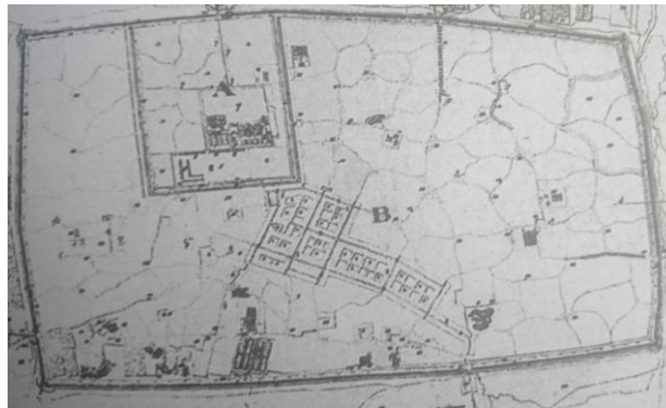
نقشه ۱. نخستین نقشه شهر تهران

نخستین نقشه تهیه شده از شهر تهران در سال ۱۲۰۵ شمسی (۱۲۴۱ق)، مقارن با بیست و نهمین سال سلطنت فتحعلی شاه به دست «نازکوف» یکی از افسران ارتش روسیه صورت گرفت (نقشه ۱). نقشه بعد را الیاس برزین، شرق شناس روس در سال ۱۲۳۱ ش (۱۲۶۸ ق) در چهارمین سال سلطنت ناصرالدین شاه و ۲۱ سال پس از نقشه نازکوف تهیه کرد (نقشه ۲) که نشان دهنده گسترش شهر در باغها و زمینهای درون حصار صفوی است که البته در مقایسه با تحولاتی که تنها چند سال بعد، در پایتخت به وقوع می پیوندد چندان زیاد نیست.