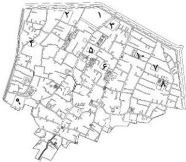
نقشه ۴. عودلاجان در سال ۱۲۳۷ شمسی