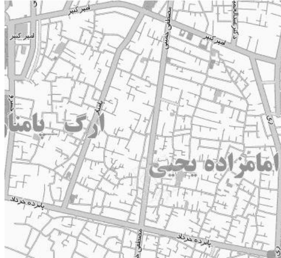
نقشه ۱. موقعیت کنونی محله عودلاجان