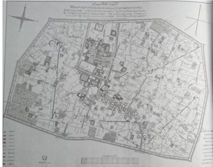
نقشه ۳. تهران در سال ۱۲۳۷ شمسی