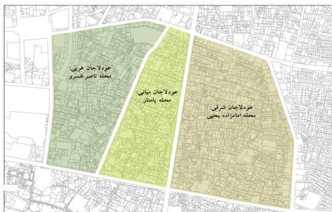
نقشه ۶. زیرمحله‌های عودلاجان

ناصرخسرو) نیز مرز میان این محله و ارگ حکومتی بود که پس از پرشدن خندق گرد ارگ در سال ۱۲۴۴ ش ( ۱۲۸۲ ق) ایجاد شد (فدایی نژاد و کرمپور، ۱۳۸۵). مرز جنوبی این محله که پیش از احداث خیابان بوذرجمهری (۱۵ خرداد کنونی) تا حوالی بازار مسگرها را در محله بازار کنونی در برمی گرفته است (نقشه‌های ۳، ۴ و ۵) پس از اجرای طرح «نقشه خیابان‌ها» و احداث خیابان بوذرجمهری در سال ۱۳۰۹ (عدل و اورکاد ۱۳۷۵: ۲۲۲)، همچنین الحاق بخشی از محله عودلاجان کهن به بازار، در حال حاضر بر خیابان ۱۵ خرداد منطبق است. خیابان‌کشی‌های سیروس (مصطفی خمینی کنونی) در زمان پهلوی اول و پامنار برخلاف مسیر گذر عودلاجان که بازار تهران را به ابتدای پامنار و محل دروازه شمیران در حصار صفوی وصل می‌کرد و ارتباطی ارگانیک با محله داشت، یکی از مشخصه‌های شهرهای کهن ایرانی بود (سلطان‌زاده، ۱۳۶۲: ۱۲۶). این خیابان‌کشی فاقد ارتباطی ارگانیک با کلیت محله بود و حاصل اتصال بخشی از گذر عودلاجان به خیابان بوذرجمهری به‌شمار می‌آمد. این فرایند در زمان پهلوی دوم و دهه ۱۳۴۰ محله را به سه پاره شرقی، میانی و غربی تقسیم کرد (نقشه ۶؛ کمیته هماهنگی، برنامه‌ریزی و طراحی بافت قدیم تهران، ۱۳۵۸: ۵۹) و آثاری را بر پایداری آن بر جای گذاشت (کمیته هماهنگی، برنامه‌ریزی و طراحی بافت قدیم تهران، ۱۳۵۸: ۶۷؛ فدایی نژاد و کرمپور، ۱۳۸۵). پس از این زمان مرزهای محله عودلاجان به شکل کنونی آن تثبیت شد.