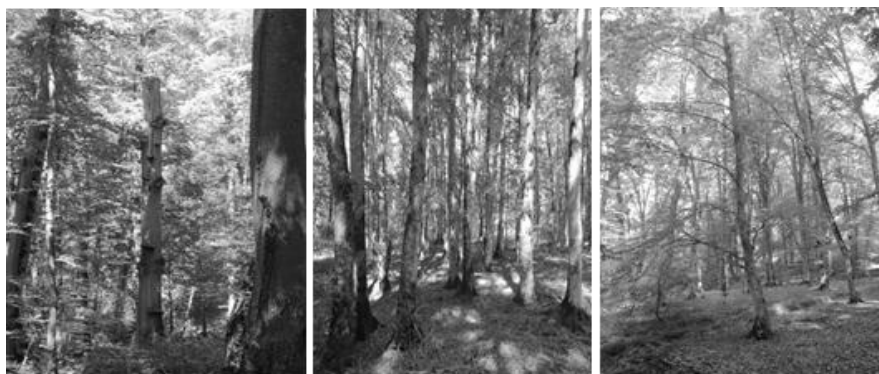
شکل ۱. مرحله‌های تحولی جنگل راش نکا، از راست به چپ به ترتیب مرحله‌های اولیه، اوج و پوسیدگی

در اجرای این تحقیق، ابتدا بخش‌هایی از قطعه 36 شاهد مشخص شد که براساس نقشه‌های کتابچه طرح جنگلداری دارای شرایط اداپیکری یکسان از لحاظ طبقات شیب، طبقات ارتفاع، سنگ مادر و خصوصیات خاک‌شناسی است [۸]. در مرحله بعد، با جنگل‌گردشی، شرایط حاکم بر توده‌های جنگلی در سطح قطعه شاهد بررسی شد. سپس سه مرحله تحولی اولیه، اوج و پوسیدگی که به‌نوعی معرف سطح چشمگیری از