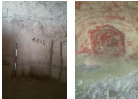
شکل ۳. (راست) محراب کنده شده در دیواره جنوبی طبقه پایین مجموعه؛ (چپ) محراب کنده شده در دیواره جنوبی طبقه بالایی مجموعه

بخش دیگر این فضای صخره‌ای، تونل طولیلی است که در سمت چپ معبد و چسبیده به آن کنده شده و ورودی اصلی آن در سمت چپ ورودی معبد قرار دارد (میرفتاح، ۱۳۶۴: ۳۷)، (شکل ۳). در سطح دیوار این معبر نشانه‌هایی از محل پیه‌سوزها دیده می‌شود (Azad, 2011: 216). وجود معبر بر پیچیدگی توزیع مراسم مذهبی جاری در معبد می‌افزاید و جنبه آیینی به آن می‌بخشد (شکاری‌نیری، ۱۳۸۵: ۶۹). ساختار، فرم و پلان این تونل (معبر) با قسمت اصلی نیایشگاه تفاوت دارد. به نظر می‌رسد، در گذشته این دو قسمت جدا از هم بوده و ماهیت کاربری متفاوتی داشته و به مرور زمان به همدیگر وصل شده‌اند.