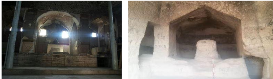
شکل ۵. (راست) مصطبه سازی، سکوی نیایش و پوشش جناغی مجموعه صخره‌ای رصدخانه؛ (چپ) مصطبه‌سازی، سکوی نیایش و پوشش جناغی کلیسای هوانس مراغه