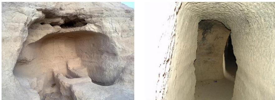
شکل ۴. (راست) قسمتی از تونل مجموعه رصدخانه؛ (چپ) قبرهای مجموعه رصدخانه

بخش دیگر این فضای صخره‌ای، تونل طولیلی است که در سمت چپ معبد و چسبیده به آن کنده شده و ورودی اصلی آن در سمت چپ ورودی معبد قرار دارد (میرفتاح، ۱۳۶۴: ۳۷)، (شکل ۳). در سطح دیوار این معبر نشانه‌هایی از محل پیه‌سوزها دیده می‌شود (Azad, 2011: 216). وجود معبر بر پیچیدگی توزیع مراسم مذهبی جاری در معبد می‌افزاید و جنبه آیینی به آن می‌بخشد (شکاری‌نیری، ۱۳۸۵: ۶۹). ساختار، فرم و پلان این تونل (معبر) با قسمت اصلی نیایشگاه تفاوت دارد. به نظر می‌رسد، در گذشته این دو قسمت جدا از هم بوده و ماهیت کاربری متفاوتی داشته و به مرور زمان به همدیگر وصل شده‌اند.