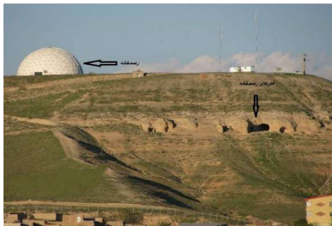
شکل ۱. موقعیت قرارگیری فضاهای صخره‌کند تپه رصدخانه (نگارندگان)

در دامنه ضلع غربی تپه رصدخانه تعدادی فضای صخره‌ای واقع شده است (اعتضادالسلطنه، بی تا: ۵؛ Kleiss, 1976: 51؛ Kinneir, 2004: 156؛ Azad, 2011: 216). (شکل ۱). وضع خاص و مشکل توجیه کاربرد واحد مزبور و اینکه بر فراز تپه نشانه‌ای از واحدهای رصدخانه به چشم نمی‌خورد، سبب شده بود که تا سال‌ها این محل را با عنوان رصدخانه بشناسند؛ به طوری که بر اساس نوشته مُدرس رضوی؛ معماری صخره‌ای دامنه تپه، همان رصدخانه خواجه‌نصیرالدین است (ورجاوند، ۱۳۸۴: ۱۵۴).