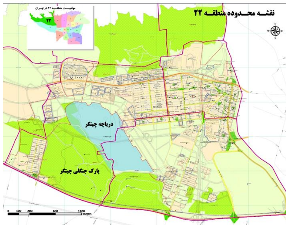
شکل شماره ۲. موقعیت پارک چیتگر در غرب تهران

پایین ترین نقطه ارتفاعی پارک، ۱۲۲۵ متر از سطح آب های آزاد ارتفاع دارد و بلندترین نقطه ارتفاعی آن نیز ۱۳۱۳ متر و متوسط ارتفاع نیز حدود ۱۲۶۹ متر می باشد (شرکت جهاد تحقیقات آب و آبخیزداری، ۱۳۸۱: ۱).