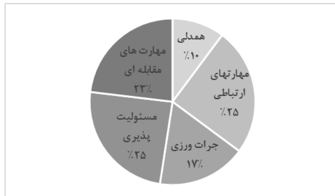
نمودار ۱. درصد فراوانی مقوله‌های مؤلفه‌های مهارت‌های اجتماعی در سند تحول بنیادین

در مرحله بعد، به منظور برآورد میزان درجه اهمیت شاخص‌ها از روش آنتروپی شانون استفاده شد. آنتروپی در تئوری اطلاعات شاخصی است برای اندازه‌گیری عدم اطمینان، که از طریق توزیع احتمال بیان می‌شود. بر اساس این روش، محتوای سند تحول بنیادین آموزش و پرورش از نقطه نظر سه پاسخ‌گو یا گزینه شامل فصول یک و دو و سه (کلیات، بیانیه ارزش‌ها، و بیانیه مأموریت)، فصول چهار و پنج (چشم‌انداز و هدف‌های کلان)، و فصول شش و هفت (راهبردهای کلان و هدف‌های عملیاتی) و پنج مؤلفه هدف طبقه‌بندی و تجزیه و تحلیل شدند.