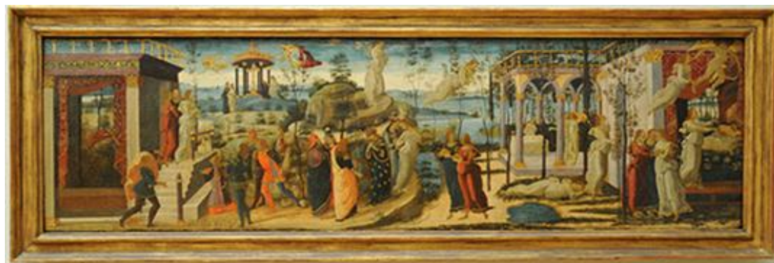
تصویر ۳: یاکوپو دل سلايو، داستان پسوخه .

گودمن داستان پسوخه از یاکوپو دل سلايو ۱ (تصویر ۳) را مورد بررسی قرار می‌دهد که تصویرگر روایت عشق میان کوپید و دختری به نام پسوخه است. رویدادهای متعدد در یک چشم‌انداز واحد، «با حضور پسوخه در هر یک از آنها» («داستان‌های تاب‌خورده»، ۱۹۸۱، ص. ۱۰۱) قابل تشخیص هستند. پسوخه به عنوان شخصیت اصلی داستان در جامه‌ی سپید در همه‌ی صحنه‌ها حضور دارد و «غیرممکن بودن حضور یک شخص در مکان‌های مختلف در زمانی واحد ما را متوجه این موضوع می‌کند که تفاوت وضعیت مکانی در صحنه‌های مختلف می‌بایست به عنوان تفاوت موقعیت زمانی اتفاقات به تصویر کشیده‌شده تفسیر شود» (همان، ص. ۱۰۱). نقاش با استفاده از حضور مکرر پسوخه نشان می‌دهد که رویدادها یکی پس از دیگری و با گذشت زمان اتفاق می‌افتند. توالی اصلی داستان پسوخه با قرارداد زبانی در غرب مطابقت دارد. به علاوه، «جهت اصلی روایت کردن با استفاده از جهت‌دهی شخصیت‌های بزرگ‌تر از پسوخه تعیین می‌شود» (همان، ص. ۱۰۴) که در آن هفت شخصیت از هشت شخصیت سفیدپوش پسوخه متمایل به راست هستند.