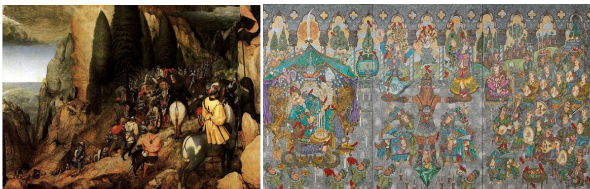
تصویر ۱: پیتر بروگل پدر، تغییر کیش پال قدیس. تصویر ۲: علی اکبر صادقی، به مناسبت هفتاد و پنجمین تولد

فرآیند علت و معلولی و کنش زمانی وجود ندارد و همگی متعلق به لحظه‌ای واحد هستند، بدون نقطه‌ی شروع و پایان داستان. همچنین، در پس‌زمینه‌ی تصویر ستون‌هایی را می‌بینیم که فضا را به دو نیم کرده است. فضای وسیع جلویی مربوط به جشن درون کاخ شاهی و فضای پشتی شامل دسته‌ی سربازان در سمت راست و جماعت نظاره‌گر در منتها الیه چپ تصویر می‌باشد. تقسیم‌بندی فضا و صحنه‌ها با شخصیت‌های مجزا روابط مکانی بین اجزای تصویر را موجب شده‌است، اما از لحاظ زمانی هیچ صحنه‌ای جلوتر از صحنه‌ی دیگر نیست. از نظر گودمن «این تصویر روایتی است بی‌زمان، بدون توالی وقوع و توالی روایت‌کردن؛ چراکه هیچ ترتیب الزامی یا غالبی برای تفسیر تصویر وجود ندارد - ترتیبی که روابط مکانی تصویر را به روابط زمانی مربوط سازد» («داستان‌های تاب‌خورده»، ۱۹۸۱، ص. ۱۰۱).