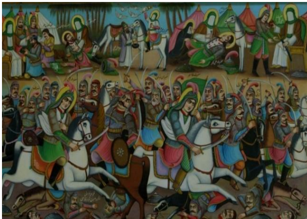
تصویر ۵: پیرو دی کازیمو، کشف عسل.