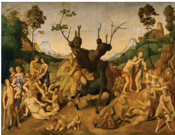
تصویر ۶: نقاشی قهوه‌خانه‌ای نبرد کربلا از محمد فراهانی