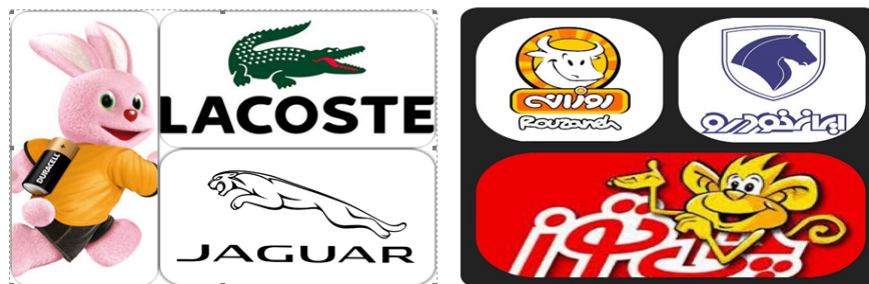
شکل ۲. مسکات‌های مطالعه‌شده در پژوهش

با توجه به توضیحات ذکر شده، مطالعه ما بر نمادهای حیوانی موجود در ۶ برند (داخلی و خارجی) شامل میمونک چی توز، گاو روزانه، اسب در ایران خودرو، خرگوش باطری دوراسل، پلنگ جگوار و سوسمار لاگوست، انجام شده است که تصاویر این مسکات‌ها را در شکل ۲ مشاهده می‌کنید.