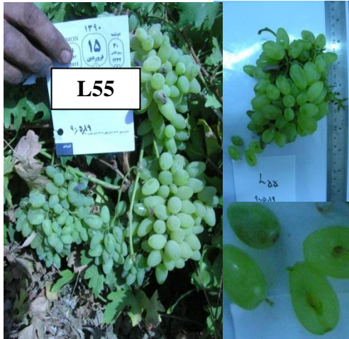
شکل ۴. نژادگان بی دانه L55 انگور Figure 4. Seedless grape genotype L55