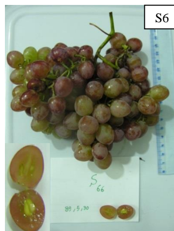
شکل ۷. نژادگان به نسبت بی‌دانه S66