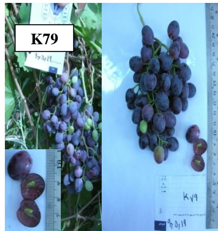
شکل ۲. نژادگان بی دانه K79 Figure 2. Seedless grape genotype K79