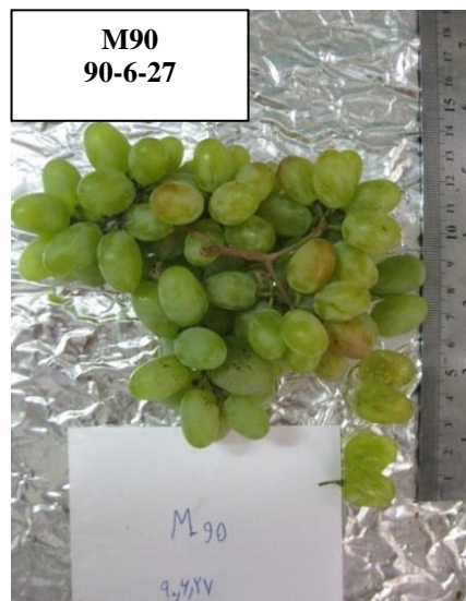
شکل ۳. نژادگان به کلی بی دانه M90 انگور Figure 3. Seedless grape genotype M90