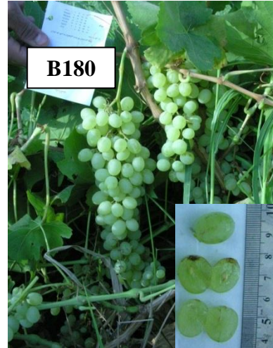
شکل ۱. نژادگان بی دانه B180 Figure 1. Seedless grape genotype B180