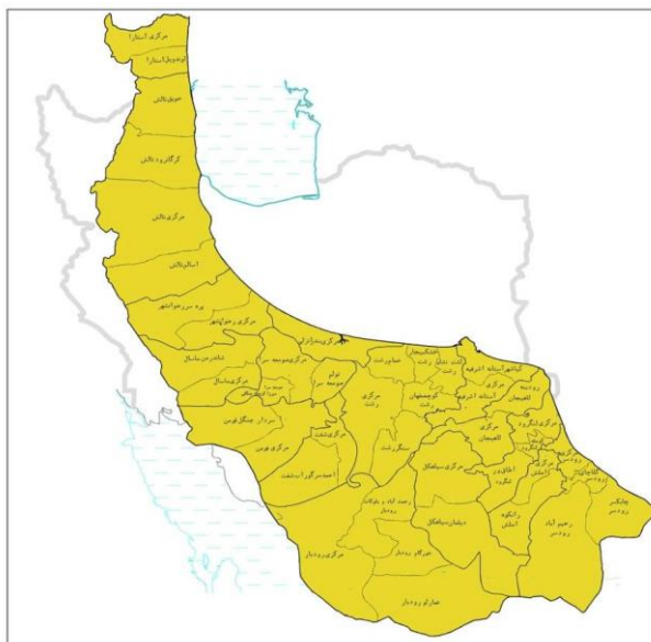
شکل ۱. تقسیمات اداری استان گیلان بر حسب بخش قرارگیری بخش‌های استان گیلان