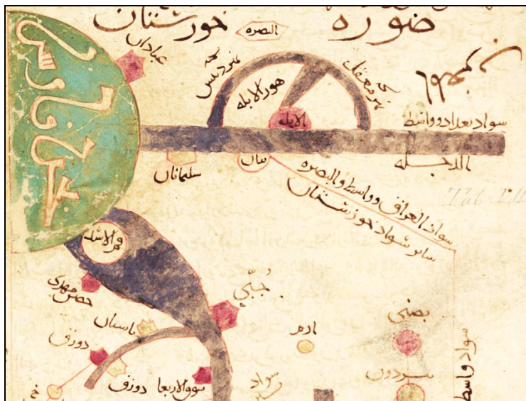
شکل ۱. جایگاه فم‌الاصد در بحر فارس مسالك و ممالك اصطخری، بنیاد گوته آلمان

حدود العالم من المشرق الى المغرب دهنه شیر را پس از «باسبان» و پیش از «حصن مهدی» در این رود می‌داند: «دودیگر رود شوشتر است اندر ناحیت خوزستان و ابتداء او از حدود شهر جبال رود بر شوشتر و سوق الاربعاء و اهواز و جیبی و باسبان بگذرد تا به دهنه شیر و حصن مهدی رسید» (حدود العالم، ۱۳۴۰: ۴۵).