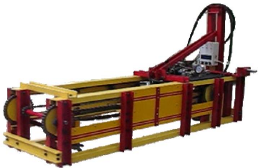
شکل ۲. دستگاه سنجش مقاومت مکانیکی خاک

آوردن ضرایب روابط (۲) تا (۴) (روابط بکر، گوتلند و بنوئیت و آپادیا یا) که شامل عرض صفحه نیز هستند، استفاده از داده‌های حداقل دو آزمون فشار _ نشست با دو صفحه متفاوت ضروری است. اما در این آزمایش‌ها، برای بالا بردن دقت در ارائه ضرایب، از سه صفحه استفاده گردید. شکل و اندازه صفحه‌های مورد استفاده و همچنین میزان فشار اعمالی به خاک در آزمون‌های فشار _ نشست، استاندارد خاصی ندارد؛ با این حال در این آزمایش‌ها سعی بر آن شد تا ابعاد صفحه‌ها به گونه‌ای انتخاب گردند که بیشتر محققان در تحقیقات خود از آن‌ها استفاده کرده‌اند. هندسه و ابعاد این صفحه‌ها در شکل (۳) قابل مشاهده بوده و در جدول (۱) ارائه شده است. قابل ذکر است که هر سه صفحه، دارای مساحت یکسان بودند و تنها ضریب رعنائی ۲ آنها با یکدیگر متفاوت بود. برای محاسبه ضرایب هر یک از روابط مورد نظر، از نرم افزار متلب (MATLAB R2016a) استفاده گردید.