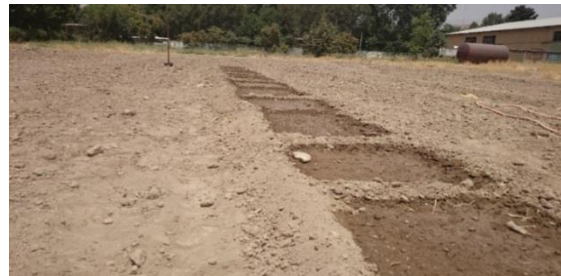
شکل ۱. تقسیم قطعه زمین به قسمت‌های کوچکتر به منظور آبیاری یکنواخت

یکنواخت آبیاری، اجازه می‌دهند تا با مرور زمان، محتوای رطوبت خاک تبخیر شده و با نفوذ بخشی از آب به خاک‌های زیر سطحی، به شرایط مورد نظر رسیده و سپس به انجام آزمایش‌ها می‌پردازند. برای ایجاد سطوح مختلف فشردگی خاک نیز خاک شخم خورده به عنوان پوک‌ترین (غیر فشرده‌ترین) تیمار در نظر گرفته می‌شود و معمولاً برای بالا بردن سطح فشردگی در آن منطقه از غلتک، عبور دادن تراکتورهای چرخ لاستیکی و چرخ زنجیری، فشرده سازهای ارتعاشی و سایر عوامل فیزیکی فشرده کننده خاک استفاده می‌کنند. در این پژوهش برای کنترل رطوبت و فشردگی؛ ابتدا از قطعه زمین انتخاب شده، سه قطعه به ابعاد ۱×۲۰ متر انتخاب گردید. به دلیل اینکه آبیاری یکنواخت قطعه زمینی با این ابعاد در مزرعه کاری بسیار دشوار می‌باشد (به علت هموار نبودن سطح خاک و همچنین زمان لازم برای رسیدن آب از ابتدای قطعه به انتهای آن). هر یک از این قطعه زمین‌ها به چند قسمت مساوی تقسیم گردید (شکل ۱) و سپس به همه قسمت‌ها به مقدار یکسان آب اضافه شد. همچنین در اجرای آزمایش‌ها، خاک شخم خورده به عنوان خاک پوک در نظر گرفته شد و برای ایجاد دو سطح فشردگی دیگر از تراکتور استفاده گردید.