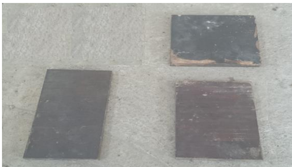
شکل ۳. صفحات مورد استفاده در آزمون‌های فشار_ نشست