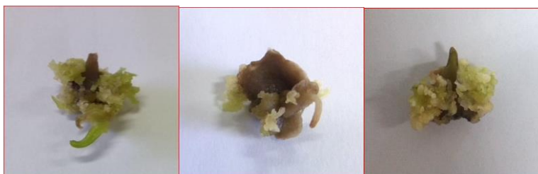
شکل ۲. فلس‌هایی که تحت تأثیر امواج فراصوت قرار گرفته‌اند.

در آزمایش چهارم، بهترین ترکیب‌های هورمونی NAA و BA که از آزمایش اول برای ریشه‌زایی نتیجه گرفته شده بود، همراه با زمان‌های مختلف قرارگیری در معرض امواج فراصوت با استفاده از ریزنمونه فلس بررسی شد. مشاهده‌های به‌دست‌آمده از این آزمایش نشان داد، شماری از ریزنمونه‌های فلس که در معرض امواج فراصوت قرار داده شدند، پس از ده روز از بین