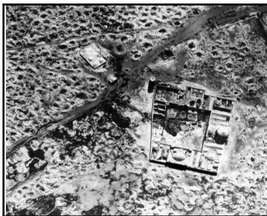
تصویر ۲: مسجد جامع ساوه، محصور در میان گودال‌های حفر شده توسط کاوشگران غیرمجاز - عکس هوایی سال ۱۳۱۵ (اشمیت، ص ۹۳)

آن‌گونه که محمدیوسف کیانی ۱۷ آورده است، ساوه در این دوره از مراکز مهم و فعال تولید سفال نیز بوده است (کیانی، پیشینه سفال و سفالگری در ایران، ص ۳۴؛ کریمی و کیانی، ص ۴۸). اریک فردریش اشمیت (Erich Friedrich Schmidt)، نیز ساوه را از مراکز مهم سفالگری دانسته (ص ۷۶) و با ارجاع به عکس هوایی سال ۱۳۱۵ که مسجد جامع ساوه را محصورشده در میان گودال‌های کاوش‌های غیرمجاز نشان می‌دهد (تصویر ۲)، در پی اثبات آن است که خاک ساوه آثار زیادی را در خود داشته است (همان، ص ۹۳).