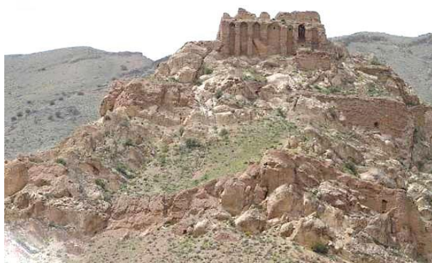
تصویر ۱: بنای ساسانی قیز قلعه (نیرومند، ۲۰۰۸)