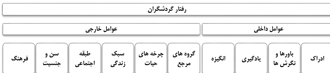
شکل ۲. عوامل تأثیرگذار بر رفتار گردشگران منبع: به نقل از لوس لومسدن (۱۳۸۰)

(Swarbrook & Horner, ۱۹۹۹). معمولاً الگوهای رفتاری گردشگران در مقصدهای گردشگری از عوامل مختلفی تأثیر می‌پذیرد. این عوامل با توجه به تقسیم‌بندی لوس لومسدن ۱ به دو دسته عوامل داخلی و خارجی تقسیم می‌شوند. این تقسیم‌بندی در شکل ۲ آورده می‌شود. عوامل تأثیرگذار داخلی عبارت‌اند از: ادراک، باورها و نگرش‌ها، یادگیری، انگیزه، گروه‌های مرجع، چرخه حیات، طبقه اجتماعی، سن، جنسیت و فرهنگ. عوامل تأثیرگذار خارجی عبارت‌اند از: ادراک، باورها و نگرش‌ها، یادگیری، انگیزه، گروه‌های مرجع، چرخه حیات، طبقه اجتماعی، سن، جنسیت و فرهنگ.