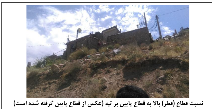
نسبت قطاع (قطر) بالا به قطاع پایین بر تپه (عکس از قطاع پایین گرفته شده است)