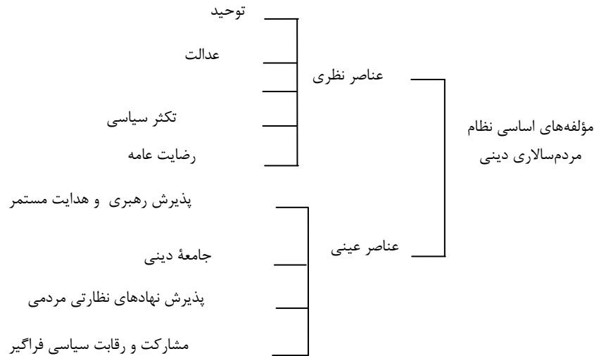
شکل شماره ۲ عناصر اصلی نظام مردم‌سالاری دینی از دید پورفرد

عماد افروغ از دیگر محققانی است که به بررسی ویژگی‌های مردم‌سالاری دینی در اندیشه امام خمینی (ره) پرداخته است. ایشان مردم‌سالاری دینی را یک الگوی حکومتی از دموکراسی می‌داند و حقوق و تکلیف مردم را در این نوع حکومت ارزیابی می‌کند. ایشان به مقایسه مردم‌سالاری دینی با لیبرال دموکراسی می‌پردازد و معتقد است در در لیبرال دموکراسی توجه به حقوق فرد (مدنی و سیاسی) غالب است و به حقوق اجتماعی و بعد وظیفه‌شناسی کمتر توجه می‌شود و بیشتر حق و حقوق مدنی مثل آزادی بیان، عقیده و فکر، آزادی ایمان و انعقاد قرار داد و مالکیت و برخورداری از عدالت فردی و حقوق سیاسی، حق انتخاب شدن و انتخاب کردن مورد توجه است.