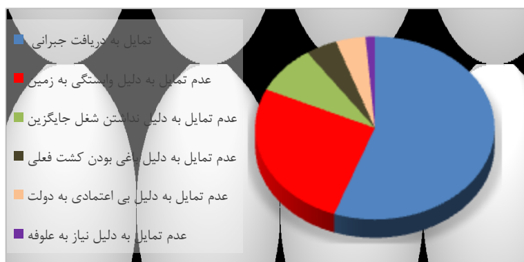
شکل ۳) نمودار تمایل بهره‌برداران به پرداخت جبرانی از طرف دولت