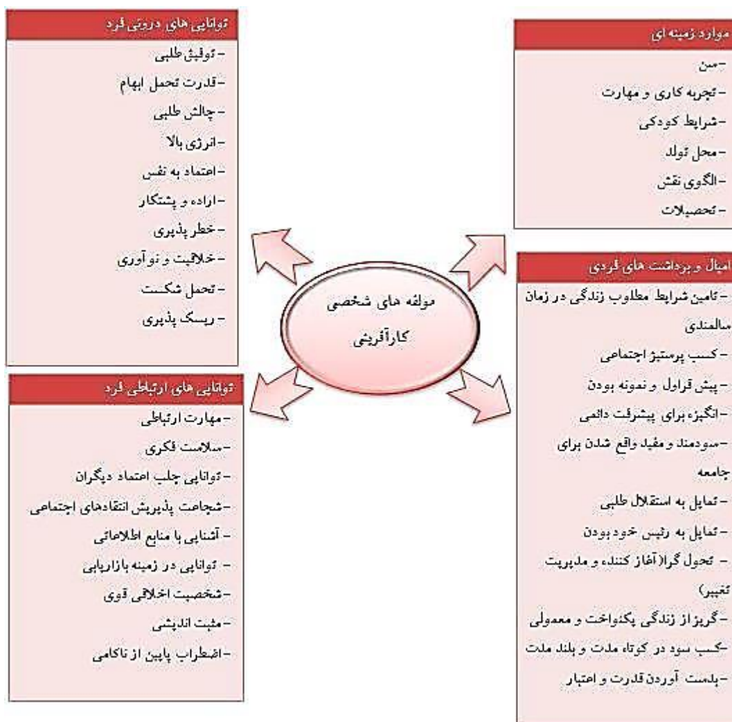
شکل ۱. شاخص‌ها و نماگرها