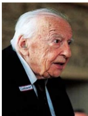
شکل ۱. هانس گئورگ گادامر

هرمنوتیک یا فلسفه هرمنوتیکی هستی‌شناسی فهم و ارمغان مارتین هیدگر (۱۹۲۷) است. هانس گادامر (شکل ۱) در پیروی از استادش، هیدگر، در حوزه هرمنوتیک، نخستین ثمر خویش را در کتاب مهم حقیقت و روش ظاهر ساخت. هانس گئورگ گادامر (۱۹۰۰ - ۲۰۰۲)، فیلسوف لهستانی اصل آلمانی، معروف‌ترین شاگرد هیدگر بود.