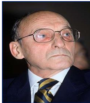
شکل ۸. ژرار ژنت

ژرار ژنت (۱۹۳۰) نظریه‌پرداز ادبی، ساختارگرا، منتقد، و یکی از تأثیرگذارترین پژوهشگران در عرصه بینامتنیت ۴ است. او واژه جدید و گسترده ترامتنیت ۵ را ابداع کرد.