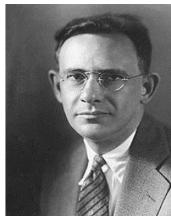
شکل ۲. ادوارد سایپیر

ادوارد سایپیر (۱۸۸۴ - ۱۹۳۹)، زبان‌شناس آلمانی، تحت تأثیر استادش، فرانس بواس ۱ ، به زبان‌شناسی عمومی روی آورد و به درجه دکتری در رشته مردم‌شناسی نائل آمد. مبدأ فرضیه نسبیت زبانی ۲ به آرای بواس، بنیان‌گذار مردم‌شناسی در امریکا، معطوف است. ادوارد سایپیر (شکل ۲) معتقد بود انسان‌ها از برخی لحاظ زندانی زبانشان‌اند. به باور او، نظر ما درباره واقعیت نسخه خلاصه‌شده‌ای از جهان است که زبان ما آن را ویرایش کرده است. وی معتقد بود جهان واقعی تا اندازه زیادی بر پایه عادت‌های زبانی هر گروهی ناآگاهانه بنا شده است. هیچ دو زبانی را نمی‌توان یافت که چنان شبیه هم باشند که تصور شود هر دو یک واقعیت اجتماعی را بازمی‌تابانند. جهان‌هایی که جامعه‌های متفاوت در آن‌ها زندگی می‌کنند در واقع جهان‌هایی متفاوت‌اند، نه آنکه جهان واحدی با برجسب‌های گوناگون باشند. به عبارت دیگر، انسان‌ها در جامعه‌های گوناگون واقعیت‌های متفاوتی را می‌بینند، زیرا به زبان‌های متفاوت سخن می‌گویند و هر زبانی واقعیت را در قالب جداگانه‌ای قالب‌ریزی می‌کند.