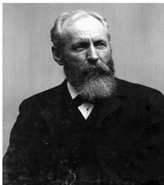
شکل ۹. جی. کارل. گیلبرت

در جغرافیا با ورود نگرش هارتشورن ۲ و جغرافیای ناحیه‌ای و سپس جغرافیای فضایی شیفر ۳ و تعبیر کروم ۴ ، فرانسوی‌ها نسبی‌گرایی را به طور عملی در تحلیل‌های جغرافیایی به کار بردند. بدیهی است به‌کارگیری هر یک از این دیدگاه‌ها موجب کاربرد روش‌های مخصوص به خود است. گوناگونی روش‌ها در تحلیل‌های جغرافیایی نیز از همین مسئله نشئت می‌گیرد. گیلبرت (شکل ۹) یکی از ژئومورفولوژیست‌های برجسته آمریکایی بود که بر تجزیه و تحلیل سیستم‌ها و زمینه فرایندهای ژئومورفولوژیکی تأکید داشت (سک ۵ ، ۱۹۹۲). گزارش زمین‌شناسی کوه‌های هنری (۱۸۷۷) وی به بررسی مکانیسم فرایندهای رودخانه‌ای اختصاص دارد. ارزش گزارش‌های علمی وی قبل از آنکه معطوف به نوشته‌های آن باشد بیشتر بر شهرت و نوآوری وی در روش پژوهش تأکید دارد. گیلبرت (۱۸۸۶، ۱۸۹۶) گفته‌های روشنی راجع به تصورش از روش علمی دارد. وی تعریف جدیدی از علم ارائه داد که با آنچه از مفهوم علم در عصر دیویس ۶ متداول بود تفاوت آشکاری داشت. به نظر وی، علم را نباید به شناخت ماهیت پدیده‌ها محدود کرد، بلکه علم دانش شناخت روابط بین پدیده‌هاست. این تعریف با آنچه برتالنفی در دیدگاه سیستمی به صورت تلویحی بعدها ارائه داد مشترک است. ولی در دنباله تعریف خود از علم به توضیحی می‌پردازد که تفاوت او را از برتالنفی نیز مشخص می‌کند.