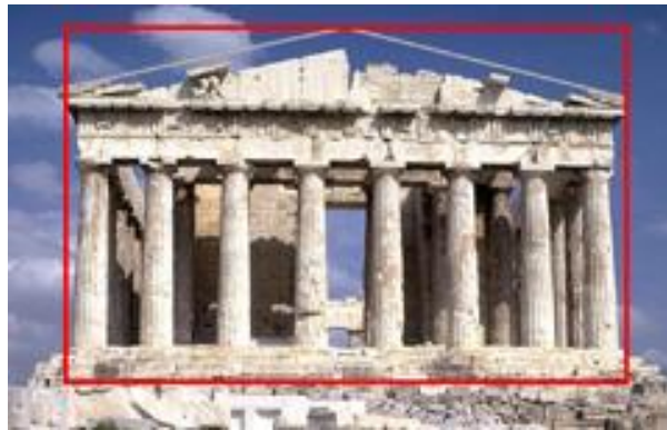
شکل ۶. پارتنون، آکروپولیس، آتن

باشد نقطه تفاوت آن با نسبی‌گرایی در دستگاه سیستمی است. به عبارت دیگر، هر نسبتی که بتواند مفهومی خاص یا پدیده‌ای خاص را به وجود آورد، فارغ از اینکه مفهوم سیستم برای آن تعمیم‌پذیر باشد یا نباشد، در حوزه نسبی‌گرایی آلومتری مطرح می‌شود. مثلاً، نسبت یا عدد طلایی - یعنی نسبت طول به عرضی که عدد ... 1.61803 را به وجود می‌آورد - تعریف‌کننده مفهوم زیبایی است. ۱ این نسبت برای هر شیء مانند انسان یا هر مفهوم دیگری مانند تعادل تعمیم‌پذیر است. شکل ۶ نسبت طلایی در معبد قدیمی پارتنون را، که با مستطیل طلایی متناسب است، نشان می‌دهد (آموتهینوا و رامون، ۲۰۱۳). بسیاری از هنرمندان بر آن‌اند که شکل‌هایی که در آن‌ها نسبت طلایی به کار رفته چشم‌نوازترین اشکال را پدید می‌آورد و مفهوم زیبایی به بیننده القا می‌شود.