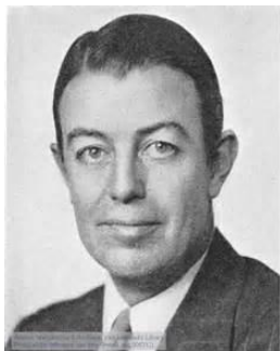
شکل ۳. بنجامین ورف