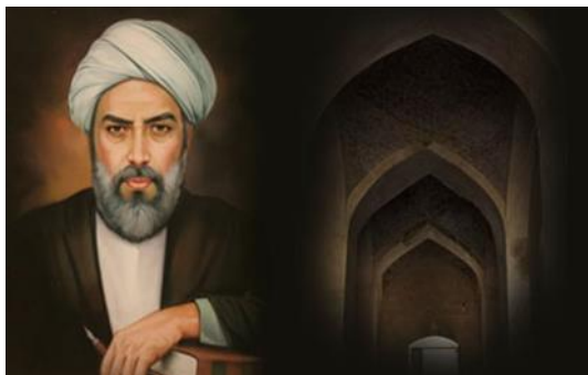
شکل ۷. ملاصدرا

صدرالدین محمد بن ابراهیم شیرازی (۹۷۹ - ۱۰۵۰ ق) ملقب به ملاصدرا و صدرالمتألهین (شکل ۷) در بیان نسبی‌گرایی آرای درخور تأملی دارد. وی در بزرگ‌ترین اثر خود، با نام الحکمه المتعالیه فی الاسفار العقلیه الاربعه ، معروف به اسفار ، مطالب خود را در چهار بخش به رشته تحریر درآورده است.