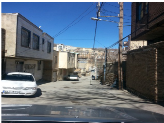
تصاویر پژوهش‌های روستایی

در پژوهش حاضر با مرور نظریه‌ها و تعاریف مرتبط، مدارک پژوهش‌های برجسته در زمینه‌های هویت مکان مطالعه و در مراحل بعد روستای دره مرادیگ بر اساس معیارهای ارائه‌شده بررسی شد. روش این تحقیق، روش توصیفی تحلیلی محتوا بود و داده‌ها به دو شیوه کتابخانه‌ای و میدانی جمع‌آوری شد. ابزار