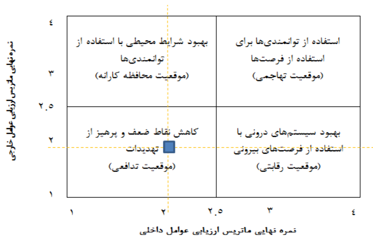
شکل ۴. ماتریس داخلی - خارجی (IE) حکمروایی شایسته و محدوده راهبردی دارای اولویت

با توجه به ماتریس IE (شکل ۴) مشاهده می‌شود که شهر بیرجند از نظر حکمروایی شایسته شهری در وضعیت مناسبی قرار ندارد، به طوری که ماتریس، موقعیت تدافعی را نشان می‌دهد.