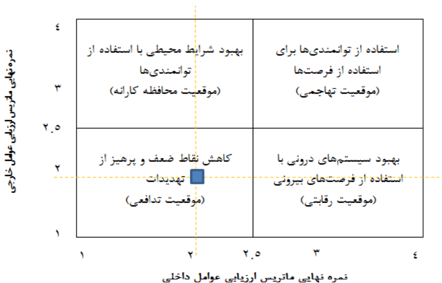
شکل ۳. ماتریس داخلی - خارجی (IE) حکمروایی شایسته و محدوده راهبردی دارای اولویت

پس از طی مراحل ذکر شده، نوبت به تشکیل ماتریس داخلی - خارجی می‌رسد. در این ماتریس از نمره‌های نهایی ماتریس‌های (IFE) و (EFE) برای تعیین موقعیت حکمروایی استفاده می‌شود. با توجه به این ماتریس موقعیت حکمروایی در شهر بیرجند تدافعی است. به دین مفهوم که از یک طرف با نقاط ضعف داخلی و از طرف دیگر با تهدیدهای خارجی روبرو است؛ در این وضعیت فعالیت‌هایی که انجام می‌گیرد باید در راستای کاهش نقاط ضعف و پرهیز از تهدیدها باشد.