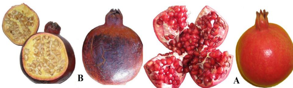
شکل ۱. میوه سالم (A) و آفتاب‌سوخته (B) انار ملس ترش ساوه

این آزمایش روی درختان شش ساله انار رقم ملس ترش ساوه در یک باغ تجاری واقع در شهرستان ساوه (۳۴/۹۹ درجه عرض شمالی و ۵۰/۲۵ درجه طول