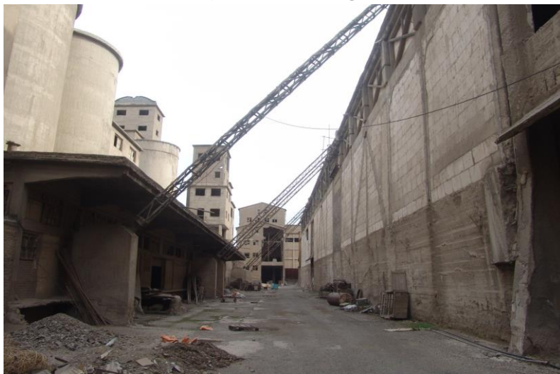
تصویر ۸: نمایی از انبار سیمان و اهرم‌های بارگیری