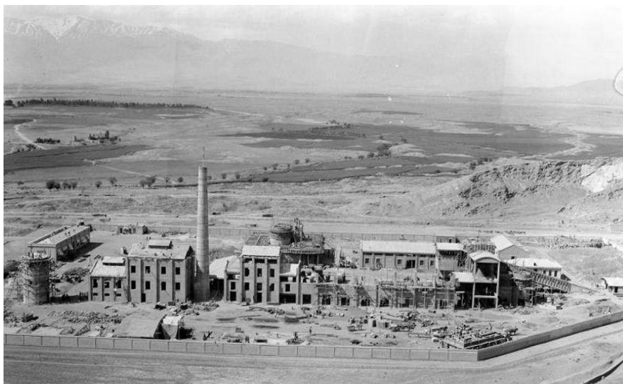
تصویر ۱: کارخانه سیمان در حال ساخت