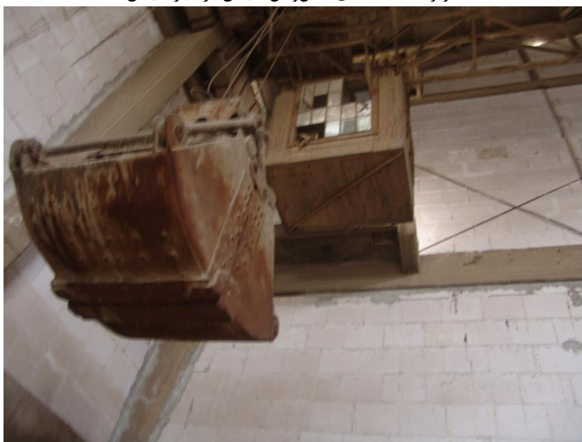
تصویر ۹: دستگاه‌های حمل و نقل سیمان در انبار سیمان