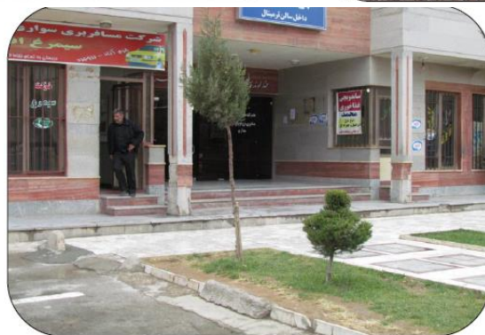
تصویر ۱. نمایی از فضاهای نامناسب عمومی در شهر خرم‌آباد