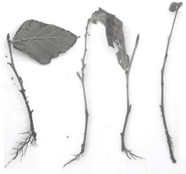
شکل ۲. قلمه‌های یکساله ریشه‌دار شده (به ترتیب از راست: تیمار شاهد، تیمار ۵۰۰، ۱۰۰۰ و ۲۰۰۰ میلی‌گرم در لیتر)