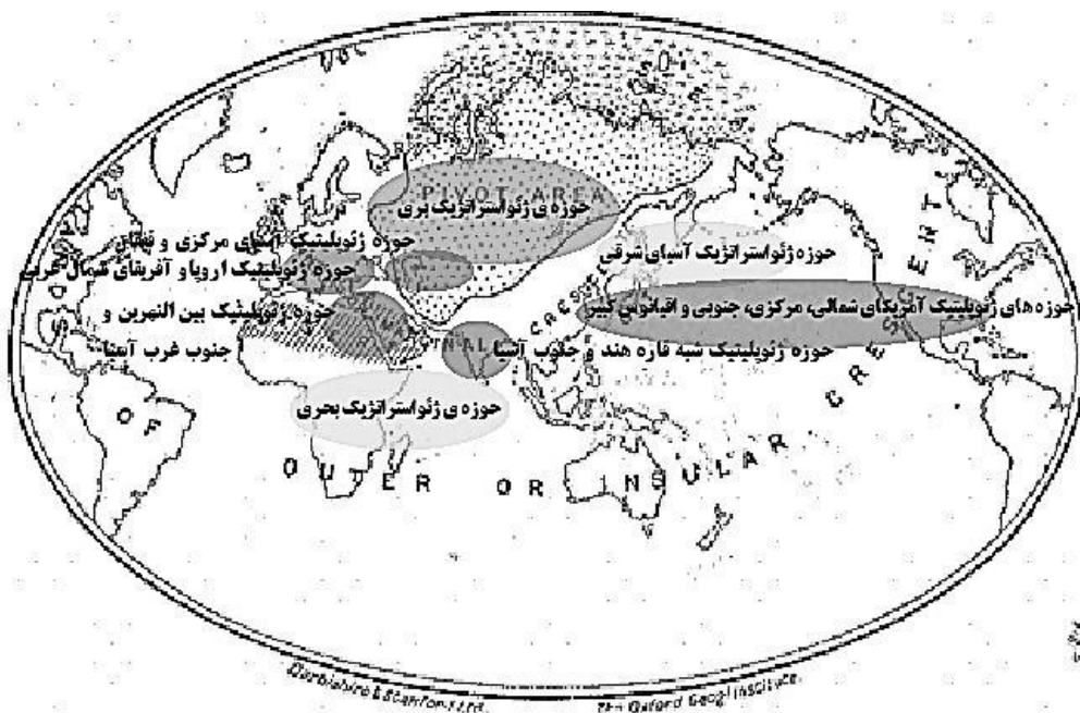
شکل ۱. دسترسی موقعیت ژئوپلیتیک ایران به قلمروهای ژئواستراتژیک و ژئوپلیتیک (مکیندر، ۱۹۰۴: ۴۲۱-۴۳۷)

موقعیت جغرافیایی ایران از پایدارترین عوامل تأثیرگذار بر قدرت ملی این واحد سیاسی است. بر این پایه، افرادی بر این باور هستند که «آنچه موجب اتصال و ارتباط ایران با نظام جهانی و تأثیرگذاری و تأثیرپذیری ایران در سدهٔ اخیر شده، موقعیت جغرافیایی در چهارراهی کشور ایران بوده و این عامل ایران را با نظام بین‌الملل مرتبط کرده است» (اطاعت، ۱۳۹۱: ۵۴). برژینسکی ایران را در یکی از شش منظومه قدرت قرار می‌دهد: ۱. منظومهٔ آمریکای شمالی، ۲. منظومهٔ اروپا، ۳. منظومهٔ آسیای شرقی، ۴. منظومهٔ آسیای جنوبی، ۵. منظومهٔ ناموزون مسلمانان و ۶. منظومهٔ احتمالی اوراسیا. هریک از این منظومه‌ها ویژگی‌های خاص دارند. سه منظومهٔ اول مصرف‌کنندگان اصلی انرژی هستند. منظومهٔ ناموزون مسلمانان که شامل خاورمیانه و شمال آفریقا است، تنها تولیدکننده‌های انرژی هستند که در این میان، منطقهٔ خلیج فارس، منطقهٔ صادرکنندهٔ مواد خام است (نامی و دیگران، ۱۳۸۸).