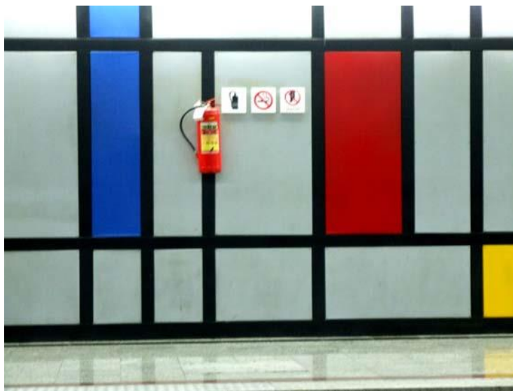
تصویر ۱. کاربرد رنگ در فضا؛ ایستگاه دانشگاه علم و صنعت

۱. سن: از آنجا که مسافران مترو از گروه‌های مختلف سنی تشکیل شده‌اند، ضروری است گرافیک محیطی، پاسخ‌گوی نیازهای همه گروه‌ها باشد. با توجه به آنچه در