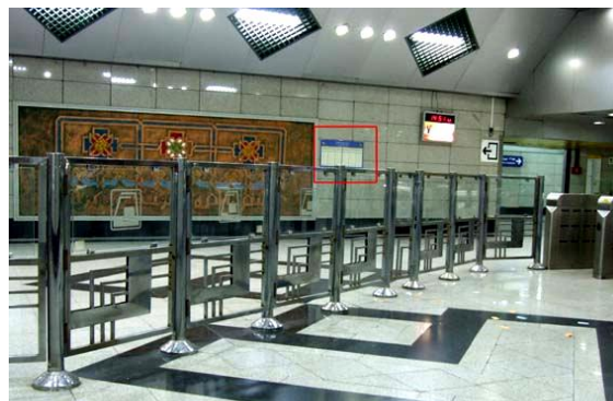
تصویر ۸. سالن اصلی ایستگاه متروی امام حسین(ع)

در این تصویر مجموعه‌ای از پیکتوگرام در سکوی ایستگاه نصب شده است که اغلب این تصاویر ناکارآمد هستند؛ مثلاً کاربرد نشانه نمایانگر کافی‌شاپ یا روزنامه‌فروشی در سکوی ایستگاه، غیرمنطقی به نظر می‌رسد.