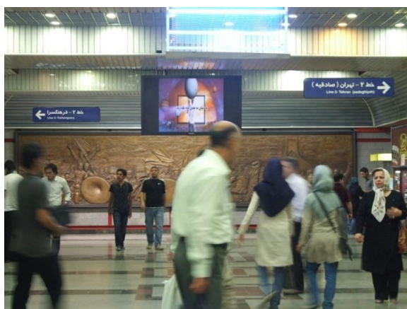
تصویر ۳. سالن اصلی ایستگاه امام خمینی (ره)

۲. جنسیت: از آنجا که در ایستگاه‌های مترو تهران، بخش‌های ویژه‌ای برای بانوان (در سکوی ایستگاه‌ها و واگن‌ها) در نظر گرفته شده است، بستر مناسبی به وجود آمده تا در طراحی عناصر گرافیک محیطی به‌ویژه در تبلیغات تجاری و فرهنگی، خصوصیات و نیازهای این جنس از مخاطبان، مدنظر قرار گرفته شود. این در حالی است که علی‌رغم وجود چنین پتانسیلی، آرایش محیطی یکسانی در تمامی بخش‌های ایستگاه‌های متروی تهران مشاهده می‌شود.