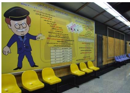
تصویر ۹. نیمکت ایستگاه امام حسین(ع)

نیمکت‌ها در سکوی هر ایستگاه با توجه به رنگ خط مربوطه رنگ‌آمیزی شده‌اند؛ البته به‌جز قسمت‌های ویژه بانوان که با رنگی متفاوت در فضا مشخص شده‌اند. در ایستگاه امام حسین(ع) که در خط ۲ مترو واقع شده است، از رنگ آبی برای نیمکت‌ها استفاده شده و قسمت‌های ویژه بانوان با رنگ زرد مشخص شده‌اند (تصویر ۹).