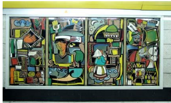
تصویر ۵. نقاشی دیواری، ایستگاه امام حسین (ع)

در ارزیابی تابلوهای اطلاع‌رسانی و جهت‌یابی در محیط‌های عمومی، باید به این نکته توجه داشت که تابلوهایی موفق به نظر می‌رسند بتوانند در رساندن پیام خود به مخاطبی که برای اولین بار وارد آن محیط می‌شود، مؤثر عمل کنند. علاوه بر شکل و رنگ و نوع خط، محل