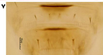
شکل‌های ۱ تا ۷. Scolothrips dorsalis : ۱. ماده؛ ۲. نر؛ ۳. شاخک (ماده)؛ ۴. سر (ماده)؛ ۵. پیش‌گرده (ماده)؛ ۶. بالچه (ماده)؛ ۷. ترژیت ۷ و ۸ (ماده).