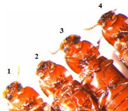
شکل ۳. ۱ و ۳ سوسک‌های تراریخت ایجاد شده توسط پلاسمید دهنده، این پلاسمید حاوی ژن Tc-vermilion تحت کنترل پروموتور 3xP3 است. ۲ و ۴ سوسک‌های استرین چشم‌سفید به منظور تزریق پلاسمید دهنده حاوی ناحیه ژنی مورد نظر به کار رفت.

(B چاهک ۲) پلاسمید اصلی حلقوی به عنوان مرجع چاهک ۳) نمونه کلون مثبت برای ناحیه ژنی ( Tc-dpn (2200 bp) (C چاهک ۴) پلاسمید اصلی حلقوی به عنوان مرجع چاهک ۵) نمونه‌های کلون مثبت برای ناحیه ژنی ( Tc-ase upstream (2993bp) (D چاهک ۶) پلاسمید اصلی حلقوی به عنوان مرجع چاهک ۷) نمونه‌های کلون مثبت برای ناحیه ژنی ( Tc-ase Intron (5036bp) (E چاهک ۸) پلاسمید اصلی حلقوی به عنوان مرجع چاهک ۹) نمونه‌های کلون مثبت برای ناحیه ژنی ( Tc-chx upstream (4050bp)