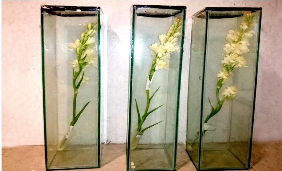
شکل ۱. ظروف شیشه‌ای طراحی شده جهت نمونه برداری و تعیین عطر گل مریم

در پی داشته است [۱۲ و ۲۷]. سالیسیلیک اسید نیز بسته به غلظت مورد استفاده سبب افزایش محتوای نسبی آب گل شاخه بریده مریم شد که می‌تواند به دلیل افزایش جذب آب از بستر بر اثر تبادلات گازی برگ با اتمسفر و همچنین نقش سالیسیلیک اسید در فرایند آنتی‌باکتریایی [۸] و در نتیجه جلوگیری از مسدودیت آوندی باشد که سبب افزایش محتوای نسبی آب گردیده است که با نتایج سایر تحقیقات بر روی گل‌های شاخه بریده میخک [۲۰] و گل رز [۳] مطابقت دارد.