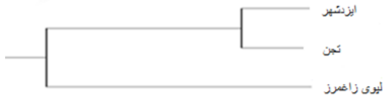
شکل ۲. دندروگرام UPGMA برای نشان دادن روابط فیلوژنتیک بین نمونه‌های مناطق مختلف ایزدشهر، رودخانه تجن و تالاب لیوی زاغمرز