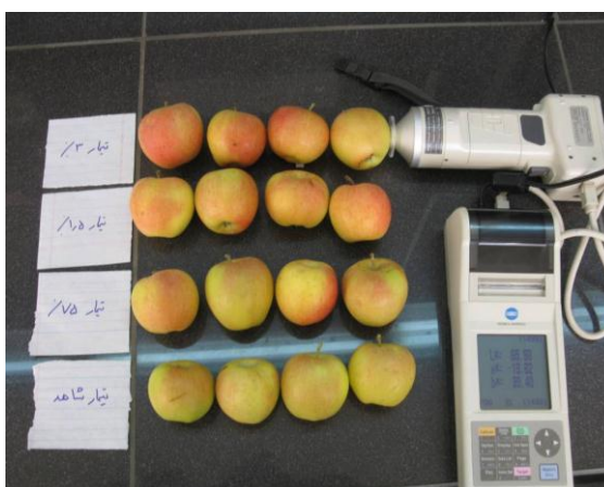
شکل ۱. رنگ‌گیری رقم گالا در سیستم تربیتی هایتک در غلظت‌های مختلف کلسیم

به‌طور کلی، نتایج حاصل از بررسی اثر نوع سیستم تربیتی و تیمار کلسیم بر میزان رنگ‌گیری میوه سیب در شرایط اقلیمی کرج نشان داد که رقم گالا در سیستم‌های تربیتی V شکل و هایتک و رقم دلبار استیوال در سیستم تربیتی هایتک رنگ‌گیری مطلوب‌تری نسبت به سیستم‌های تربیتی دیگر داشتند. نوع سیستم تربیتی از طریق تأثیر بر میزان دریافت نور توسط درخت و تأثیر آن بر میزان فتوسنتز درخت بر میزان بهبود کیفیت میوه می‌تواند مؤثر باشد. از طرفی تیمار کلسیم با غلظت ۱/۵ گرم در لیتر توانست شاخص رنگ a* پوست میوه که نشان‌دهنده سنتز رنگیزه آنتوسیانین و تولید رنگ قرمز است را به‌طور معناداری افزایش دهد و از این طریق سبب بهبود رنگ‌گیری میوه شود (شکل ۱).