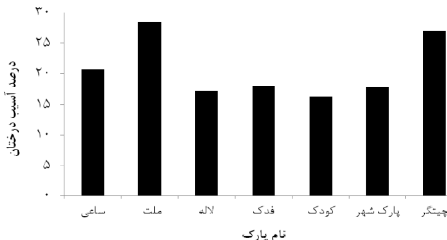
شکل ۲. درصد آسیب در پارک‌های بررسی شده